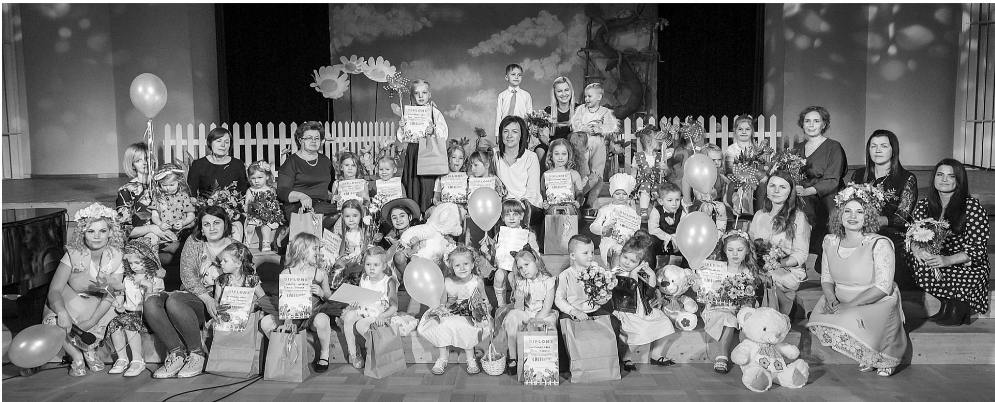
Smiltenes pilsētas mazo vokālistu konkursa „Cālis 2019” laureāti, dalībnieki un vokālās pedagoģes.