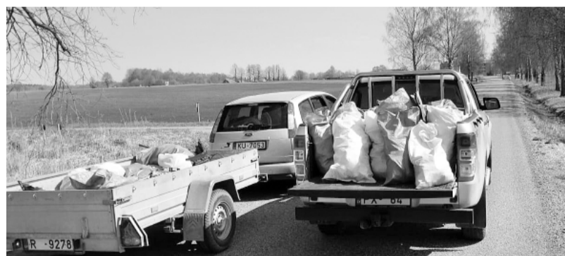
Variņu pagastā no atkritumiem tiek attīrītas ceļmalas.