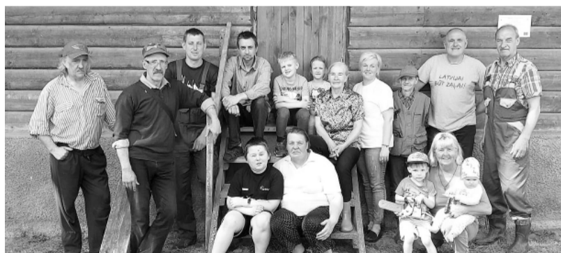
Blomes pagasta iedzīvotāji sakopa Jeberlejas estrādes teritoriju.