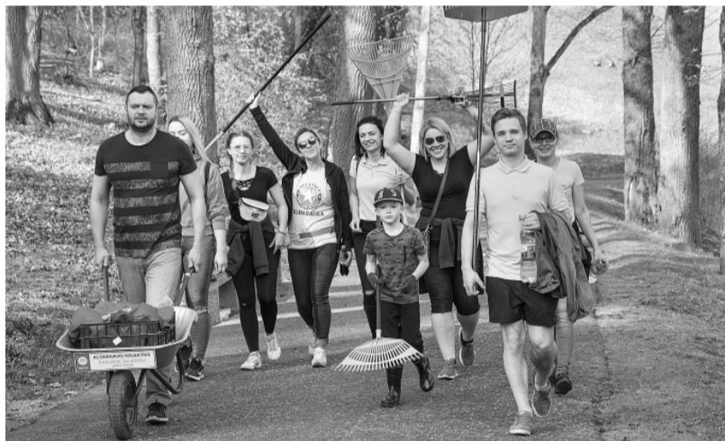
Lielajā talkā tradicionāli piedalās „Klondaikas” kolektīvs.

Saimnieciskās darbības nodaļa un talkas koordinatore