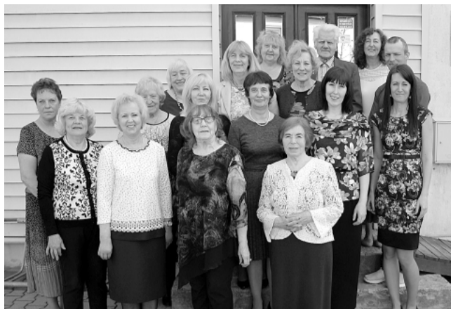
Smiltenes novada bibliotēkas bijušie un esošie darbinieki.

1923. gadu, uz laiku, ko uzskatām par Smiltenes bibliotēkas dibināšanas gadu. Kā lai mēs izskaidrojam tā laika darbiniekiem to, ko darām tagad – ar tā laika vārdiem un tā laika izpratni? Savukārt, kā mēs ar savu pašreizējo izpratni varēsim saprast to, kas būs pēc 50 gadiem? Bibliotēkara darbs ir izmainījies ļoti. Mūsdienās ar tehnoloģiju palīdzību bibliotēkām ir iespēja sniegt savus pakalpojumus attālināti. Lasītājs var nemaz nenākt uz bibliotēku. Taču tik un tā gan bibliotekāriem, gan lasītājiem joprojām svarīgas lietas ir klātesamība, saskarsme, acu kontakts, satikšanās, sirsniņa sarunās. Mēs nevaram dzīvot un strādāt bez