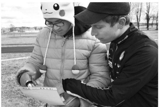
I. Caunes vadībā apgūst orientēšanos.

pastaigā pa Grundzāli, Smiltēni un Cērtēnes pilskalnu, ar lielu sajūsmu uzņēma izbraucienu ar Austrijas armijas auto (paldies J. Dingam par šo iespēju!).