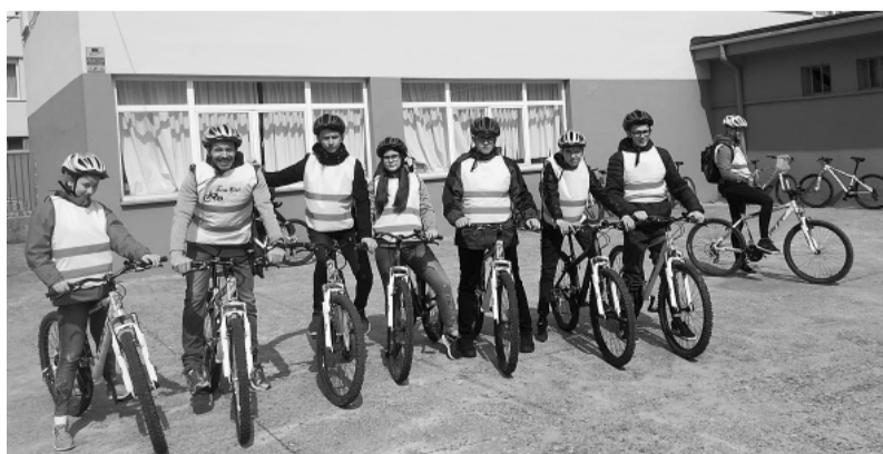
Grundzāles pamatskolas skolēni viesojas Reinosā.

dzīvot svešā, turklāt vēl angliski lāgā nerunājošā ģimenē. Bet visi secināja, ka spāņi ir ļoti atvērta, skaļa un sa-