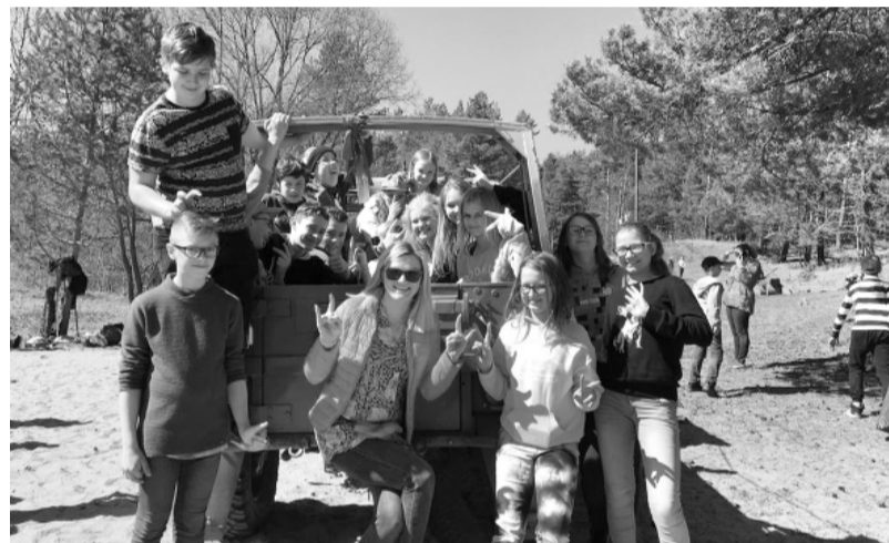
Smiltenes vidusskolas audzēkņi sakopj Klievezera apkārtni.