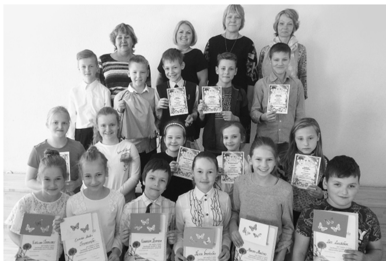
Dabaszinību olimpiādes dalībnieki un skolotājas.