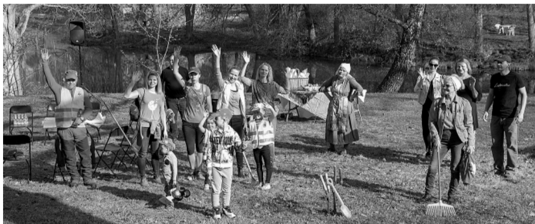
Lielās talkas dalībnieki Vecajā parkā.