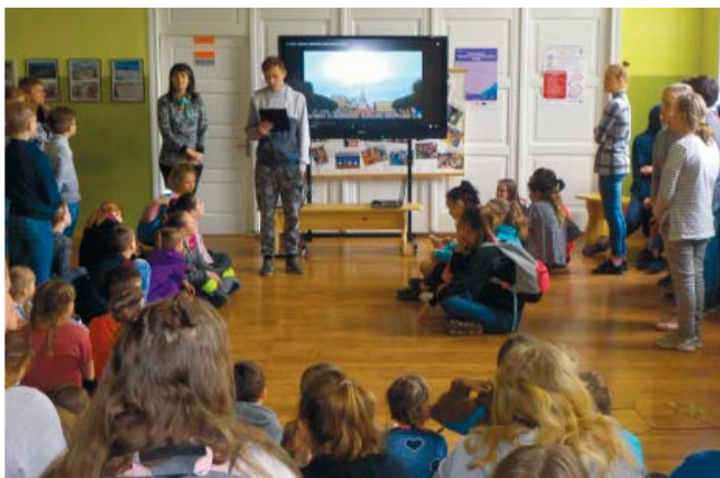
Valsts pavasara svētkos 9. klases skolēni bija sagatavojuši ieskatu mūsu valsts vēsturē.

Kā pārsteigums māmiņām bija projektā "Skolas soma" uzņemta skolēnu filma par skolu. Tajā ikviena mamma varēja re-