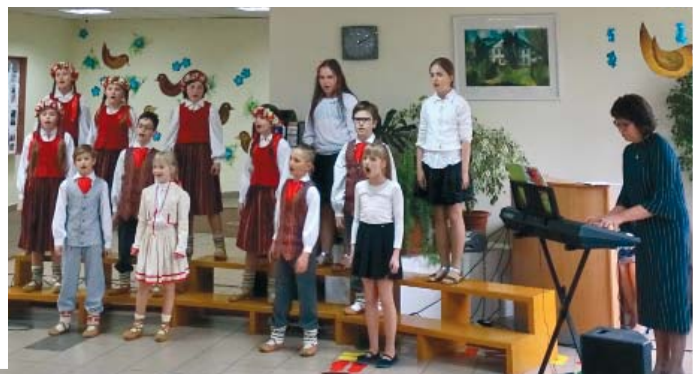
Mātes dienas pasākumā mamas tika priecinātas gan ar koncertu, gan rotu darināšanas darbnīcas iespējām. Skaisti!