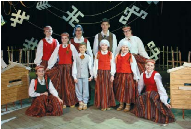
Ābeļu pamatskolas folkloras kopa "Mikālēni" ar labiem panākumiem piedalījies vairākos pasākumos.

Nav noslēpums, ka visi skolēni nepacietīgi gaida vasaru un garo brīvlaiku, kad atpūsties un krāt spēkus nākamajam mācību gadam. Vasaras brīvlaiks ir svētki! Taču par svētkiem var saukt arī Ābeļu pamatskolas audzēkņu piedalīšanos pirmsvasaras laikā notikušajos konkursos un citos pasākumos.