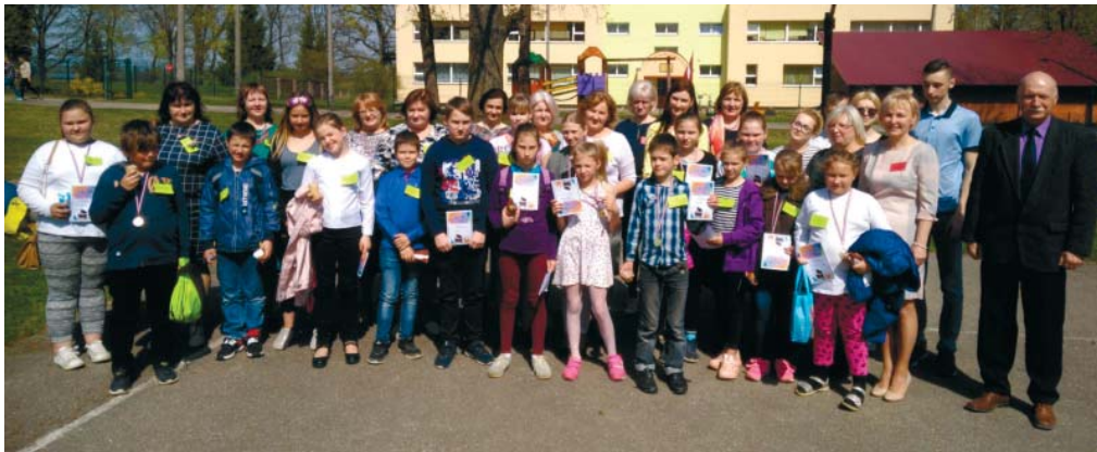
Lietpratības konkursā bērniem ar speciālo mācību programmu Ābeļu pamatskolu pārstāvēja četri skolēni.

praktiski uzdevumi (kartupeļu mizošana, mizu svēršana, plānāko un vieglāko mizu noteikšana; eiro centu monētu noteikšana tikai pēc taustes, jāsaklausā dažādas skaņas), gan teorētiski uzdevumi. Kamēr skolēni darbojas komandās un individuāli, arī skolotājiem norisinājās savs gudrinieku attapības konkurss un radošā rotu darbnīca.