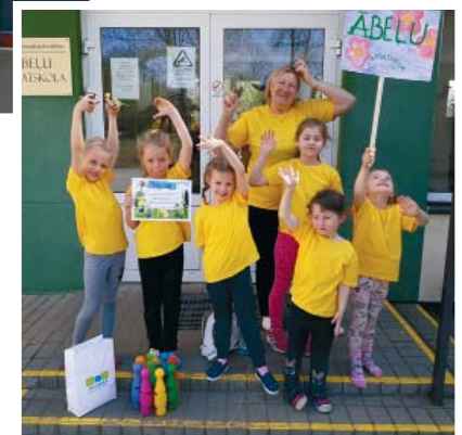
Mājup ar uzvaru! Ābeļu skolas pirmsskolnieki atgriezušies no 13. pirmsskolas sporta spēlēm Jēkabpilī.

punktiem atpalika no Atzinības rakstus ieguvušajiem konkurentiem. Kā viņš pats atzina, lai arī godalgotā vieta nav sasniegta, ir gūta pieredze turpmākajam darbam.