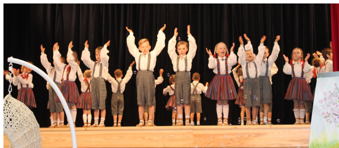
Krimuldas Tautas nama pirmsskolas vecuma bērnu deju kolektīva "Krimuldiņa" dejotāji

18.maijā Krimuldas Tautas namā jau piekto reizi notika mazo novadnieku godināšanas pasākums "Pulkā nāc!". Mazie novadnieki uz pasākumu ieradās kopā ar vecākiem, vecvecākiem, brāļiem un māsām.