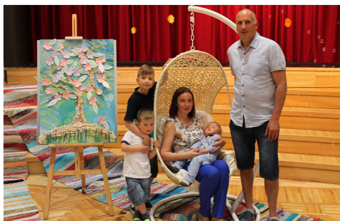
Daudzi vēlējās iemūžināt šo skaisto mirkli. Attēlā uz molberta redzama Krimuldas novada teiksmainā ābele ar jaundzimušo bērnu vārdiem

Jau savlaicīgi gan novada informatīvajā izdevumā, gan mājaslapā un pašvaldības kontos sociālajos tīklos aicinājām vecākus pieteikties pasākumam. Pasākumam pieteicās 25 ģimenes, piesakot 26 jaunus novadniekus, jo novadnieku saimē uzņēmām arī dvīņšus.