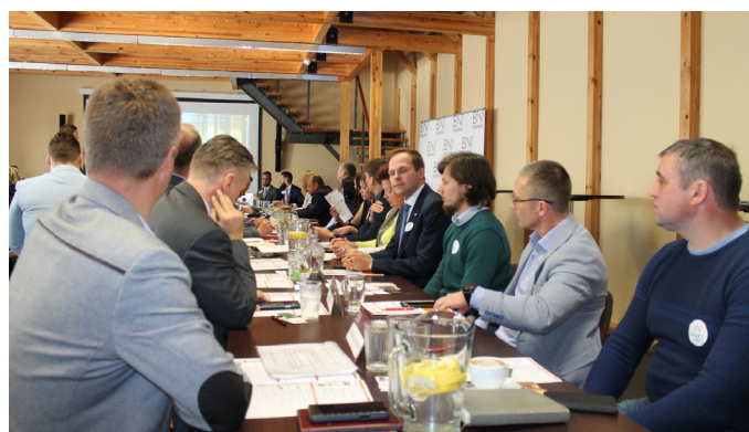
Svinīgajā sanāksmē piedalās Krimuldas novada pašvaldības domes priekšsēdētājs un uzņēmēji