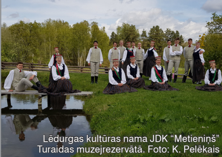
Lēdurgas kultūras nama JDK "Metieniņš" Turaidas muzejrezervātā.

Koncertā piedalās Lēdurgas kultūras nama amatiermākslas kolektīvi, Olaines 1. vidusskolas deju kolektīvs "Dzērve", Madlienas kultūras nama jauniešu deju kolektīvs "Daina" un pūtēju orķestris no Lietuvas.