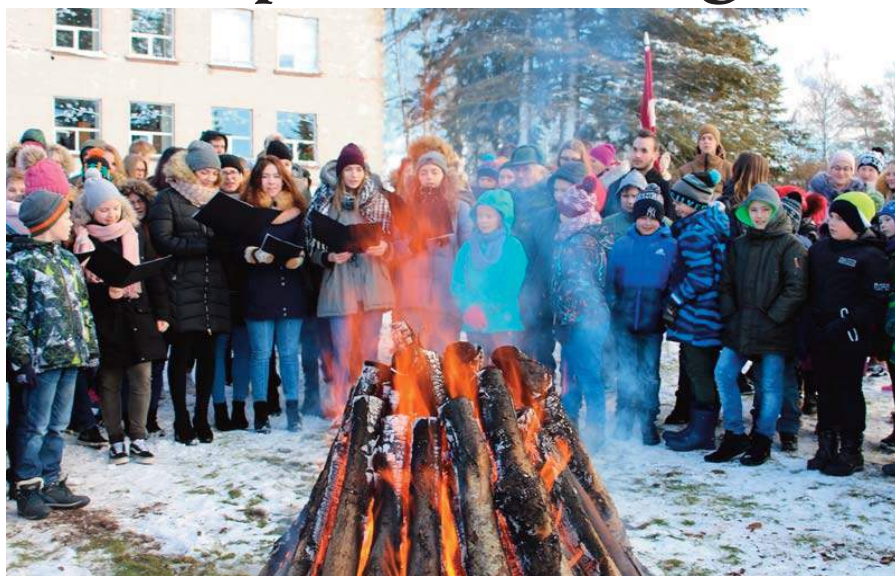
Neretas Jāņa Jaunsudrabiņa vidusskolas pagalmā skolēni un 1991. gada trauksmainā laika aculiecinieki atceras un piemin Barikāžu laiku

Rīgā smaržoja pēc dūmiem un dīzeļdegvielas – tā nereti sākas daudzi atmiņu stāsti, atceroties trauksmaino laiku pirms 28 gadiem. Bija 1991. gada janvāra Barikāžu laiks. Gads, kas sākās ar PSRS agre-