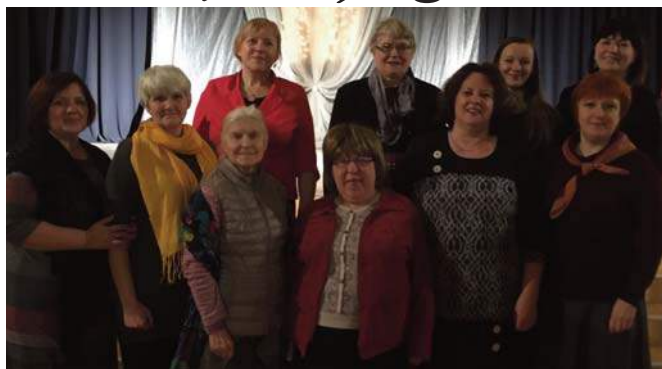
Neretas un Jaunjelgavas novadu kultūras darbinieki pieredzes apmaiņā

Jau otro gadu Neretas novada kultūras darbinieki uzsāk ar pieredzes braucienu pa kāda kaimiņnovada kultūras iestādēm, lai izzinātu viņu pieredzi kultūras dzīves organizēšanā, gūtu jaunus kontaktus. Pērn viesojāmies Vecumnieku novadā, bet šogad 23.janvārī apmeklējām Jaunjelgavas novada kultūras iestādes.