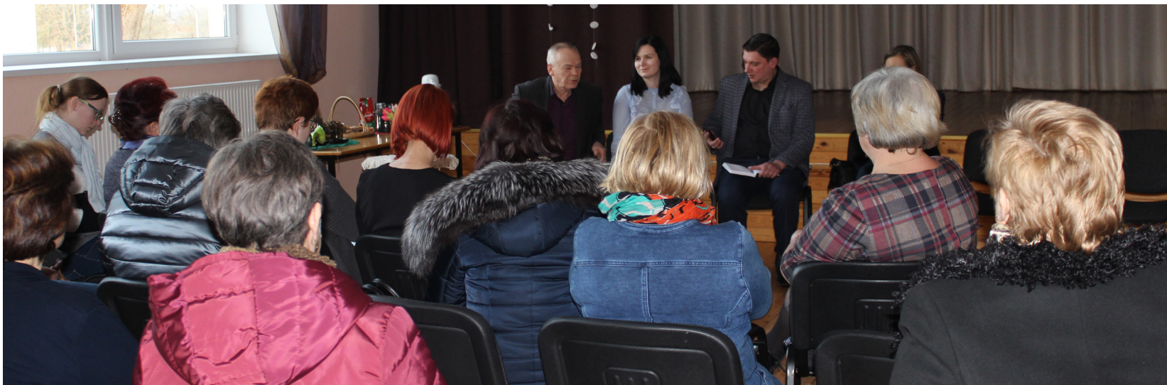
19.februārī Ilūkstes novada pašvaldības vadība un speciālisti tikās ar Subates un Prodes pagasta iedzīvotājiem