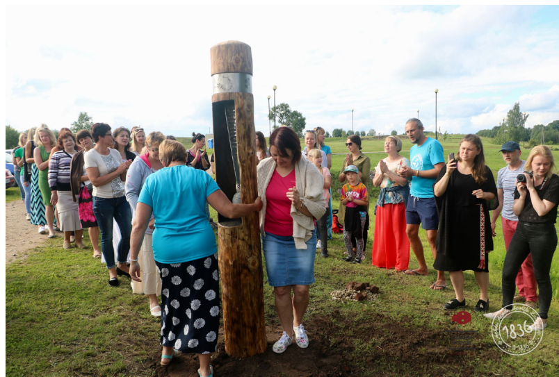
Katrā no gājienu noslēguma vietām tika ierakts viens no fonda “1836” ceļmalas stabiem, mūsu novadā tas rotājas Ilūkstē pie estrādes un tajā iegravēti reiz Imanta Ziedoņa teiktie vārdi: “Mēs esam stipri savā saderībā un drīkstam saderību sagaidīt arī no pārējiem, no ļaudīm. Taču vispirms ir jāsader sevī un savos vistuvākajos cilvēkos”