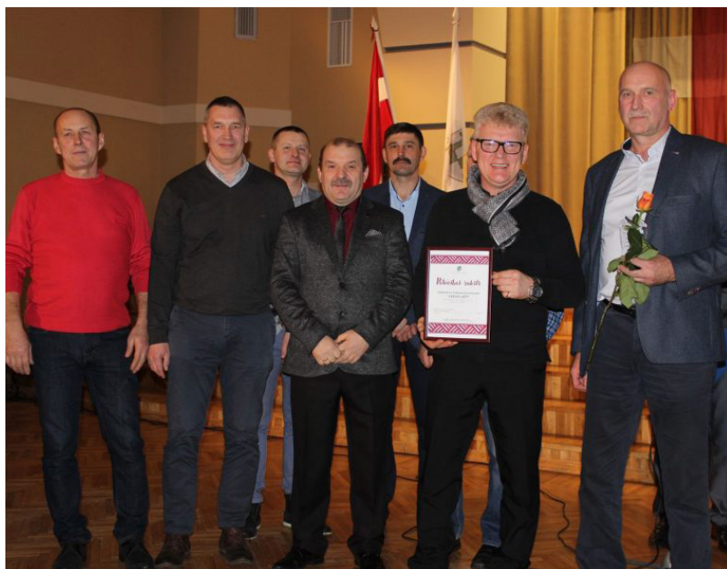
Svētķu pasākuma gaitā Pateicības rakstus un balvas saņēma arī cilvēki, kuriem sports ir dzīves neatņemamā nepieciešamība, kuri aicina un rada iespēju mūsu novada ļaudīm baudīt sportu. Priecājamies un lepojamies – mūsu sporta entuziastu un atbalstītāju pulks ir varens un spēcīgs! Suminām veterānu hokeja komandu „Ledus lāči”