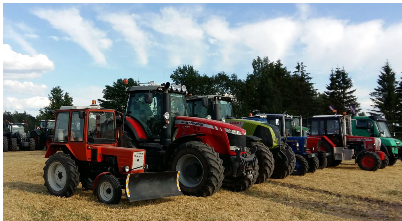
No 11. marta VTUA inspektori veiks izbraukuma tehniskās apskates Ilūkstes novadā

22. martā plkst. 9.00; 17. maijā plkst. 9.00.