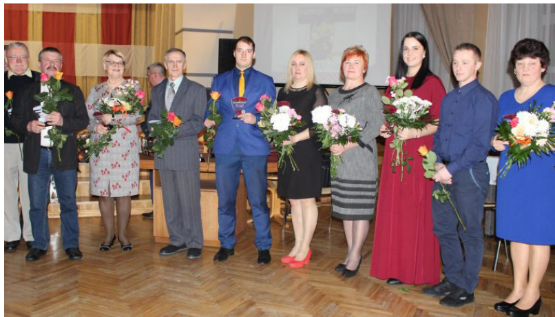
Veidojoties bērna attiecībām ar sportu, liela loma ir sporta skolotājam. Paldies visiem mūsu novada sporta skolotājiem, kuri ir, bija un būs iedvesma un atbalsts ikvienam novada bērnam

Kad atskatāmies uz notikušo un iztēlojamies iespējas, kas sagaida mūs šķīrot sporta dzīves lappuses nākotnē, saprotam, ka ārkārtīgi nozīmīgas ir tās sirdis, kuras deg sportam kā labdari, nenogurstošie darba rūķi, kuri neskaita stundas un nerēķina to cik viņi varētu nopelnīt, kas ar milzīgu sirdsdegsmi iegulda savu laiku, savus līdzekļus, lai sporta dzīve novadā kļūtu interesantāka un daudzveidīgāka, lai aizvien vairāk cilvēku jebkurā vecumā varētu izdzīvot sportu savā dzīvē. Svētķu pasākuma gaitā Pateicības rakstus un balvas saņēma arī cilvēki, kuriem sports ir dzīves neatņem-