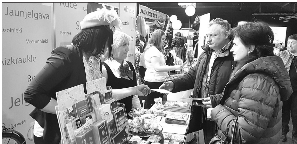
Februāra sākumā Rīgā notika gadskārtējā tūrisma izstāde "Balttour 2019", kurā aktīvi sevi prezentēja arī Aizkraukles novads. Vislielāko tūristu interesi Aizkrauklē izraisīja četri tūrisma piedāvājumi: pastāvīgā ekspozīcija "Padomju gadi", Pļaviņu HES, Raganu lidlauks Daugavas ielejā un velomaršruts pa Daugavas ieleju.

Lūgums pieteikties pasākumiem, rakstot e-pastu baiba.kelere@aizkraukle.lv . Vairāk informācija www.auc.aizkraukle.lv .