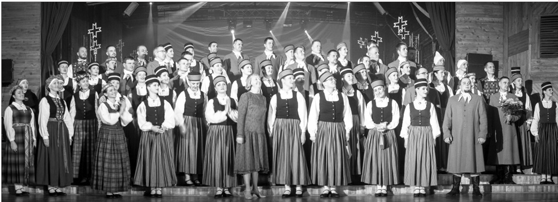
Deju kolektīvs "Pēda" ar skatu nākotnē.