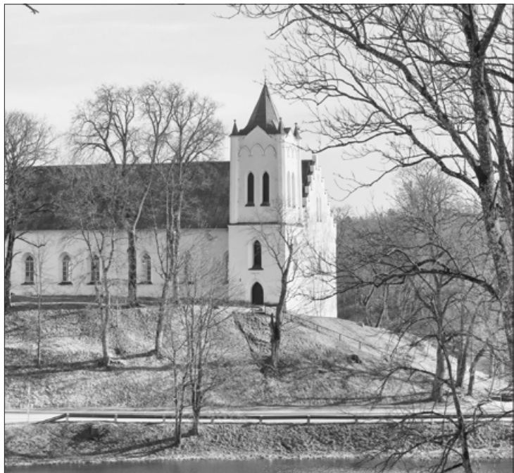
Aizputes Sv. Jāņa Baznīca

Laika grāmatu šķirstot, skats apstājas pie dažiem ar Aizputi saistītiem notikumiem, kas bijuši tālākā vai tuvākā pagātnē. Atcerēsimies!