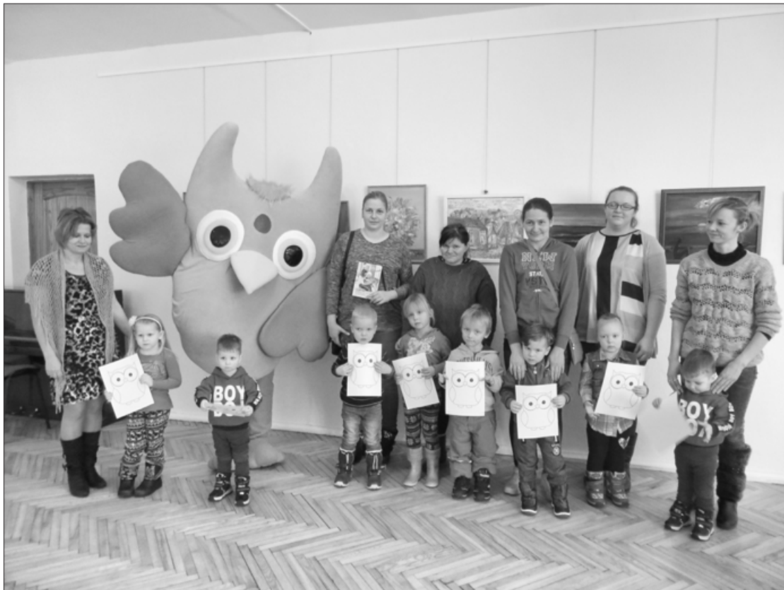
Pūčulēnu skolas pirmā tikšanās jaunajā sezonā