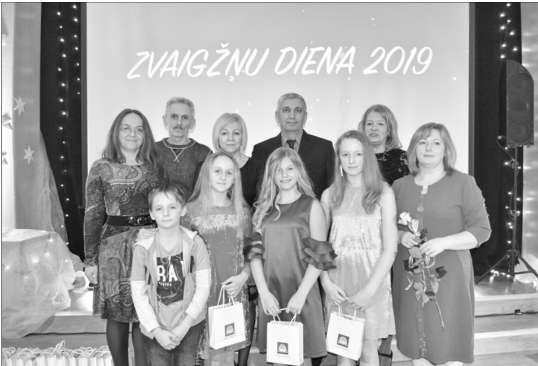
Aizputes vidusskolas 6. b klases labākie, viņu vecāki un klases audzinātāja