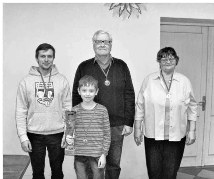
Turnīra uzvarētāji - Kuldīgas komanda

17.janvārī Dzērves saietā namā jau 10.reizi notika Dzērves kausa izcīņas sacensības komandām dambretē. Šoreiz piedalījās tikai 4 komandas, jo dažādu iemeslu dēļ pārējie nevarēja ierasties. Kā jau ierasts, sastāvi bija spēcīgi – 5 m/k un 1 sp/m, turnīrs notika divos apļos.