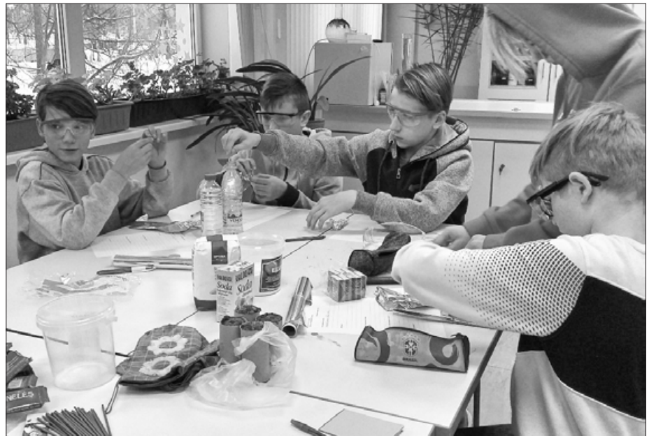
Skolēni radošajās darbnīcās "Ziemassvētku eksperimenti"

EIROPAS SAVIENĪBA Eiropas Sociālais fonds