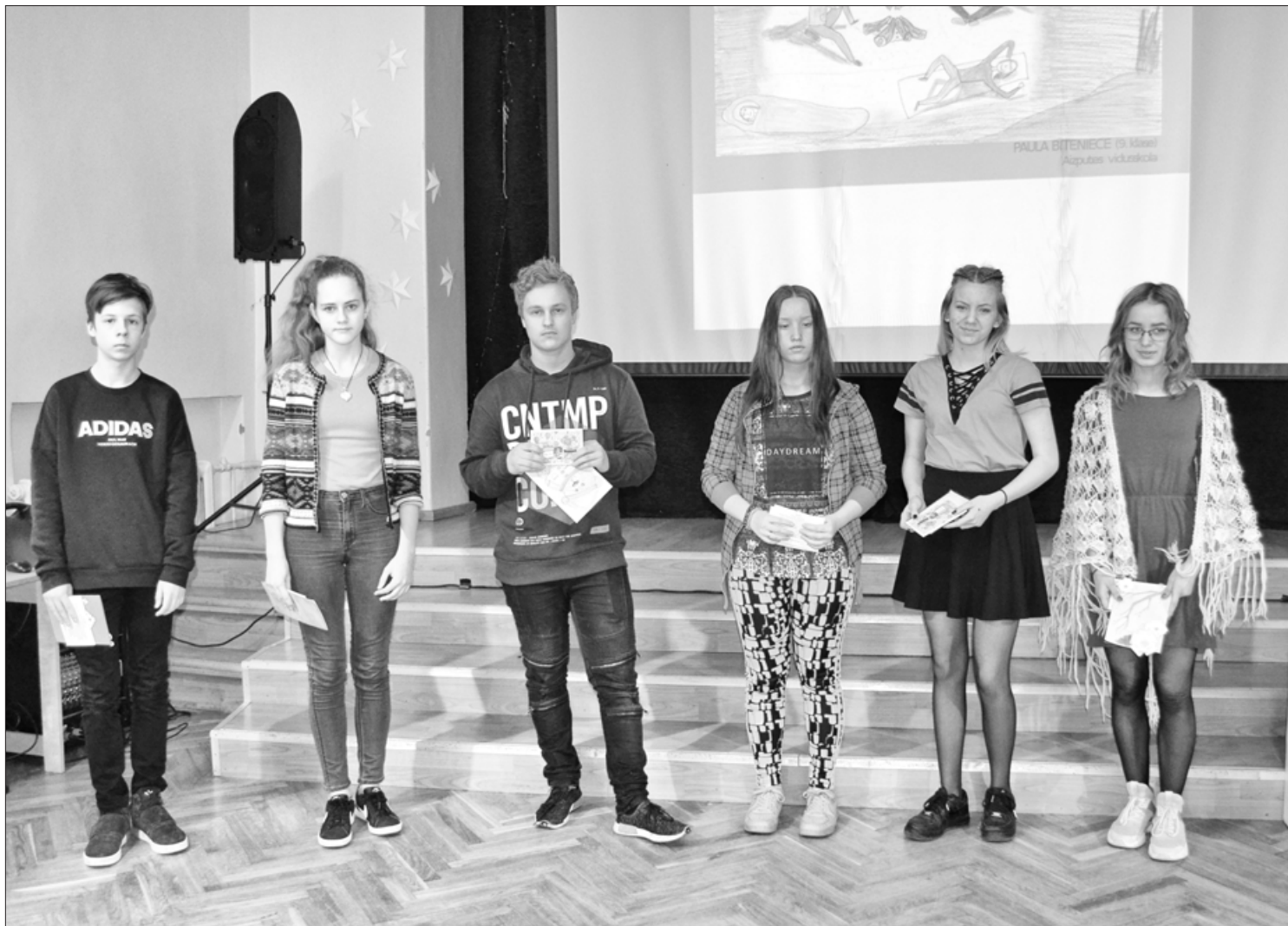
Aizputes novada radošie skolēni grāmatas atklāšanas svētkos