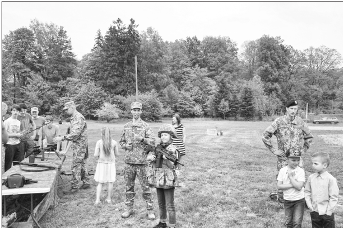
Foto no pasākuma "Par varoņiem nepiedzimst..."

Muzeju nakts diena Kazdangā tika aizvadīta ar saulainu un skaistu laiku, vienīgi pašā vakarā neliels lietus uz īsu brīdi patraucēja koncerta klausītājus.