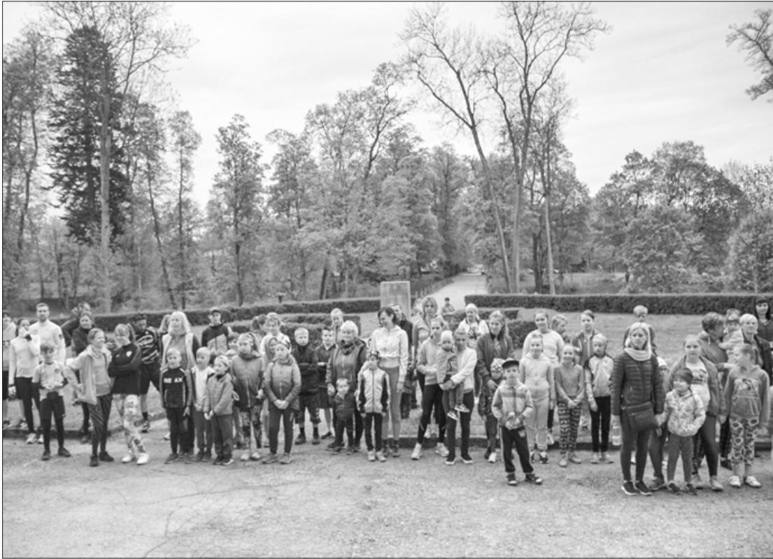
Tradicionālā skrējiena "Kazdangas aplī 2019" dalībnieki

11.maijā pie Kazdangas pils norisinājās tradicionālais skrējiens "Kazdangas aplī 2019". Šogad skrējienam jubilejas reize – 15 gadi, kopš notiek šis skrējiens. Pirmo reizi skrējiens notika 2005.gada 28.maijā. Šogad to apmeklēja kupls skaits dalībnieku – 85, kuri bija ieradušies no Aizputes, Aprikiem, Lažas pagasta, Nīkrāces, Priekules, Kuldīgas, Turlavas, Vaiņodes, kā arī vietējie sportisti no Kazdangas.