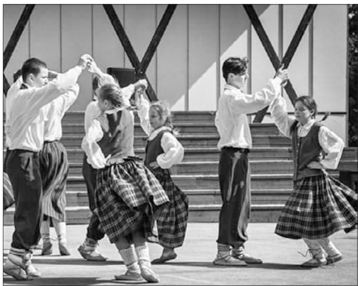
Kalvenes pagasta bērnu tautisko deju kopa

Ar vien klusāks no pašdarbnieku čalām vakaros kļūst kultūras nams. Vēl tikai dažas uzstāšanās reizes un arī pašdarbnieki aiziet vasaras darbu