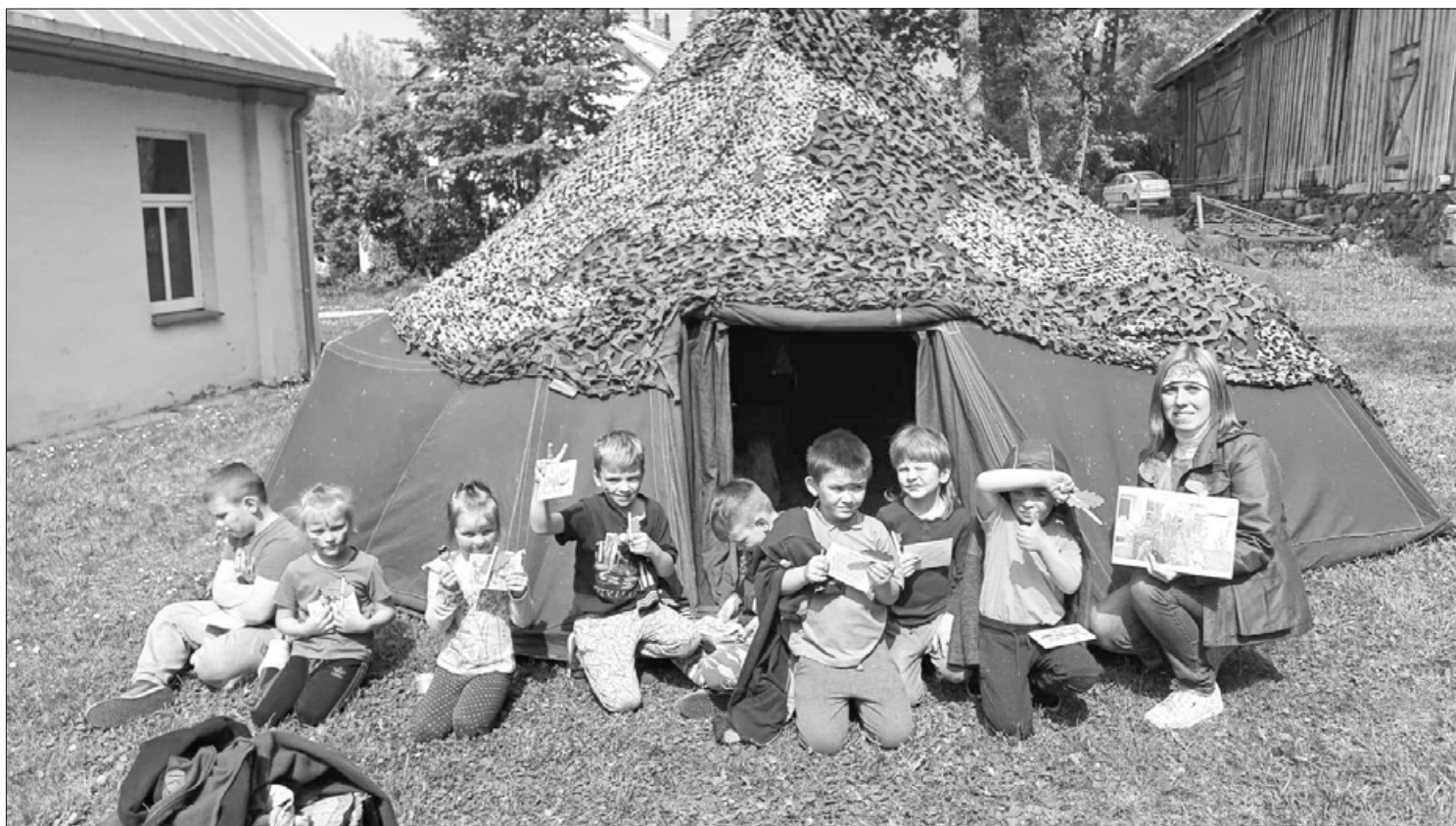
Kazdangas PII "Ezītis" sešgadnieki ar skolotāju 16.maijā

16.maijā bija liels notikums sešgadīgajiem pirmsskolas vecuma bērniem - pasākums