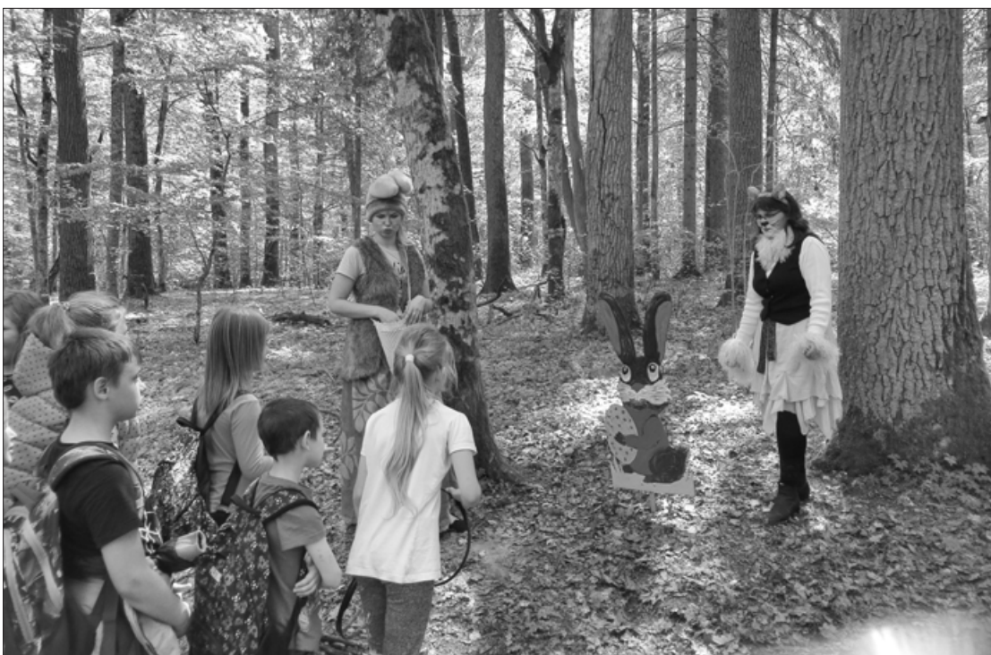
Ciemos pie Cīravas Mežaparka zvēriņiem

20. maija saulainajā pēcpusdienā Cīravas Mežaparkā notika Cīravas un Pāvilostas Bērnu žūrijas pārgājiens "Vasara, mēs nākam!". Uz šo pasākumu tika uzaicināti Pāvilostas bibliotēkas Bērnu žūrijas lasītāji, lai kopīgi ar Cīravas bibliotēkas jaunajiem lasītājiem dotos interesantā pārgājienā. Pārgājiena laikā ar jautrām