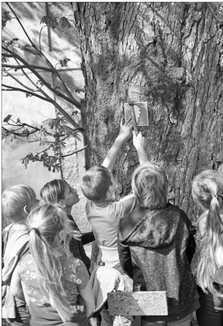
Iezīmējam jaunu dižkoku

„Šī ir mana laimīgākā diena!” Tā ikreiz dzirdam sakām kādu Dzērves pamatskolas jaunāko klašu skolēnu pēc kāda pasākuma, kas notiek ārpus klases vai skolas telpām. Tās ir dažādas aktivitātes, kuras skolēniem piedāvājam gan Ekoskolas programmas, programmas „Latvijas skolas soma” un projekta „Atbalsts izglītojamo individuālo kompetenču attīstībai” Nr. 8.3.2.2/16/I/001, gan projekta Nr.8.3.5.0/16/I/001 “Karjeras atbalsts vispārējās un profesionālās izglītības iestādēs” aktivitāšu plāna ietvaros. Mācību stundas notikušas gan Nacionālajā Botāniskajā dārzā Salaspilī, Nacionālajā Zooloģiskajā dārzā un „Mežvidu labirintā” Alsungā, gan Lidostā „Rīga”. Esam iepazīnuši Suitu novadu, tā kultūrvēsturiskās tradīcijas, baudījuši koncertus koncertzālē „Lielais dzintars”, kā arī ar interesi un aizrautību iesaistījušies mācību stundās, kuras Dzērves skolā vadījuši speciālisti no „Laboratorium.lv” un improvizācijas teātra „K – komanda”. Arī paši skolā cenšamies strādāt tā, lai zināšanas apgūt būtu interesanti un aizraujoši, organizējot gan tradicionālos skolas pasākumus, gan aktivitātes Ekoskolas programmas ietvaros.