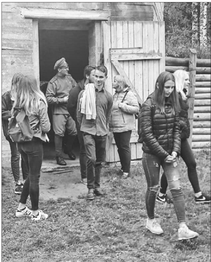
Tīrelpurvā vēstures lappuses izzinot

Katram skolēnam bija iespēja piedalīties vismaz divos pasākumos, kurus finansēja šī programma. Aizputes vidusskolā apmeklēto pasākumu klāsts bija daudzveidīgs, un otrajā pusgadā visām klasēm pasākumus izvēlējamies ārpus ierastās skolas vides.