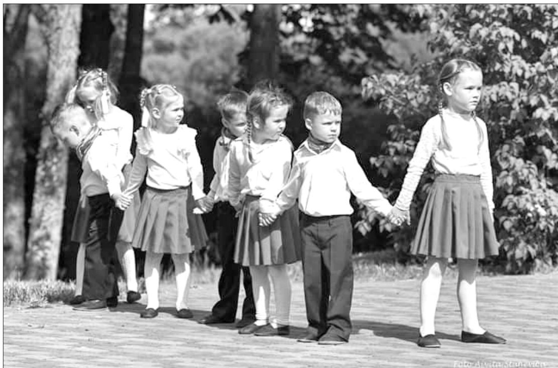
Dejo bērnu deju kolektīvs "Zīluki"

Vēl mazliet, un mēs būsīm vasarā iekšā - smaržojošā, mutuļojošā...vai tomēr lēnā un mierīgā? To varam izvēlēties katrs pats.