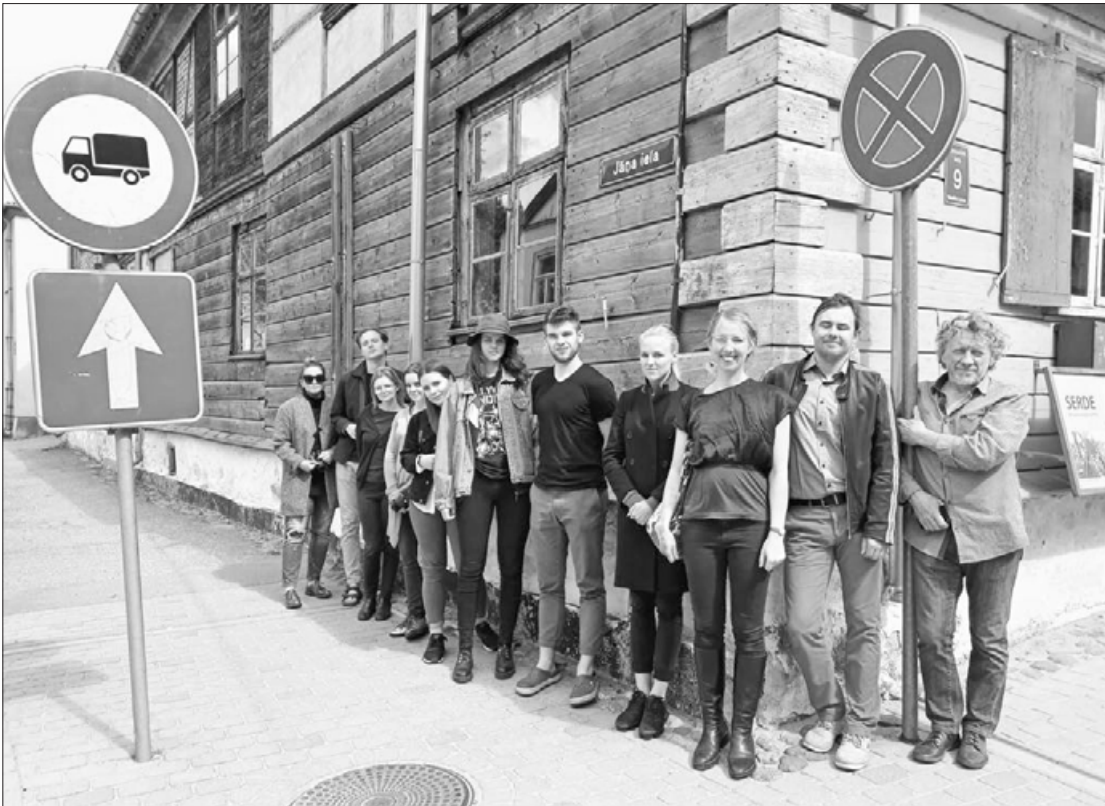
Plenēra dalībnieki pie “SERDES” ēkas

No 9.-12. maijam Aizputē, sadarbībā ar Aizputes novada domi, Ziemeļvalstu ministru padomes biroju Latvijā, RISEBA arhitektūras skolu, Viļņas Mākslas akadēmijas Klaipēdas fakultāti, Latvijas Lauksaimniecības universitāti, Rīgas Tehnisko universitāti, Jauniešu centru “Ideju Māja” un mākslinieku rezidenču centru SERDE, norisinājās starptautiskais arhitektūras