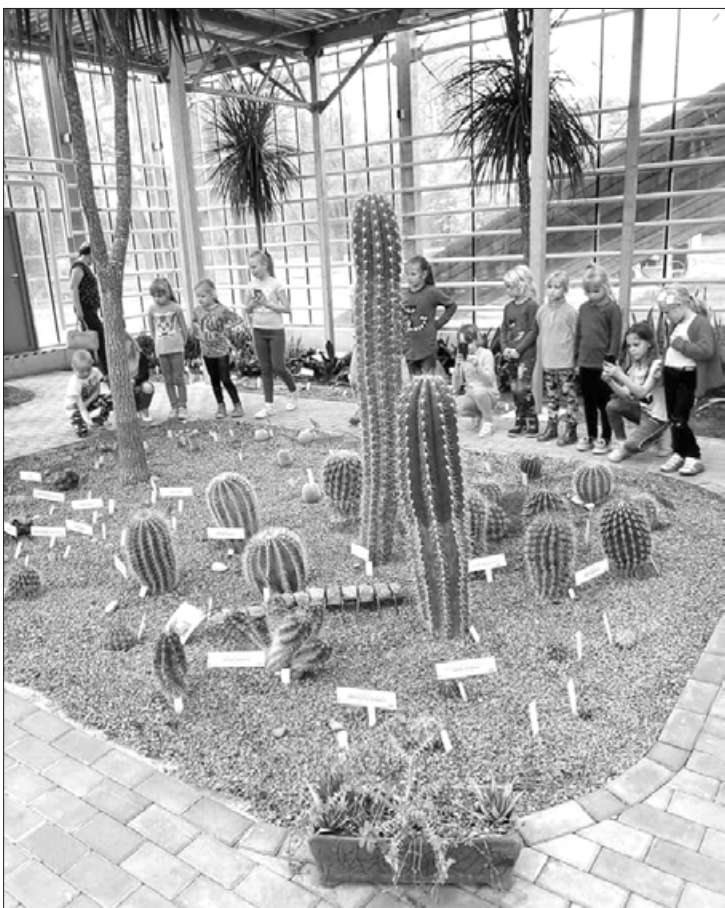
Skolēni Nacionālajā botāniskajā dārzā

Māteru Jura Kazdangas pamatskolas 1. un 2. klases skolēni 17. maijā projekta "Latvijas skolas soma" ietvaros