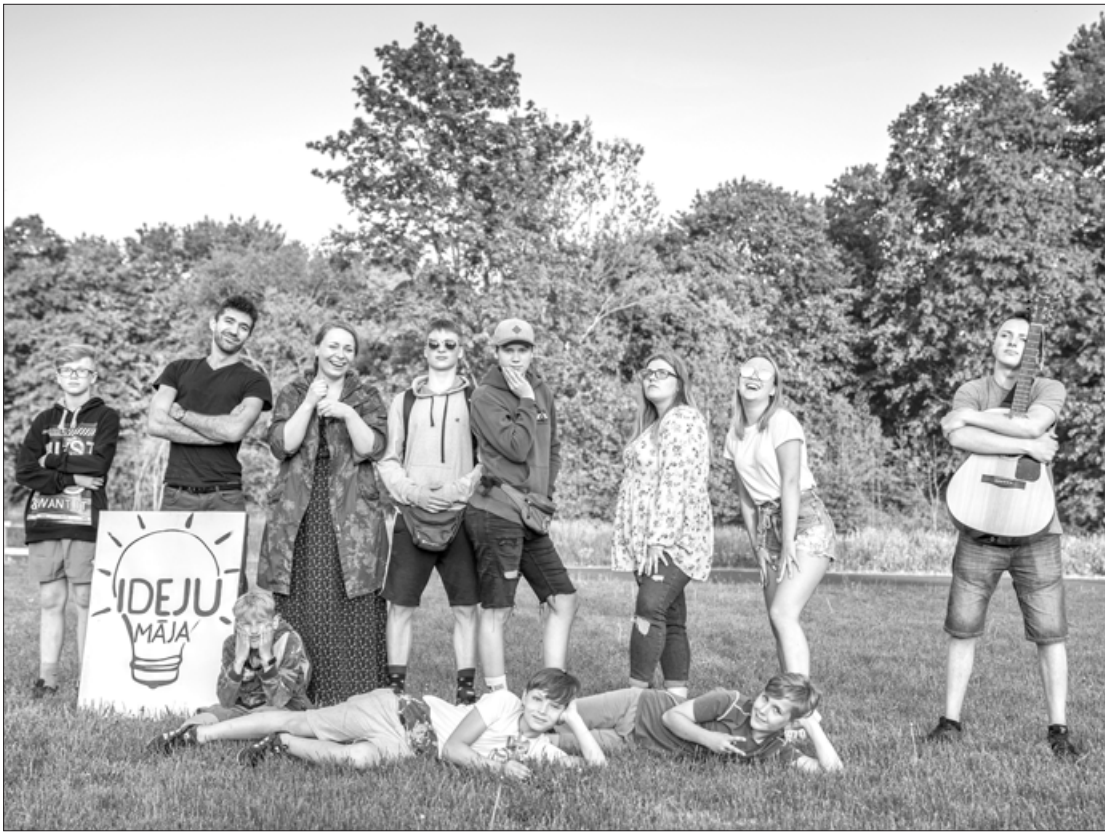
IDEJU MĀJAS jaunieši kopā ar savu jauno draugu