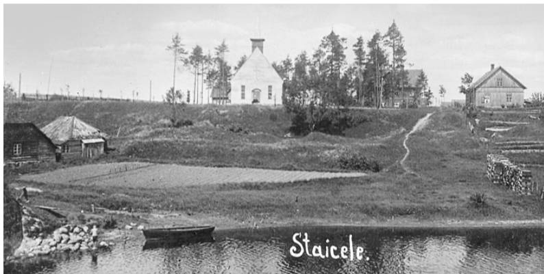
Salaca pie Staiceles, kreisajā pusē Pārceltuves mājiņa.