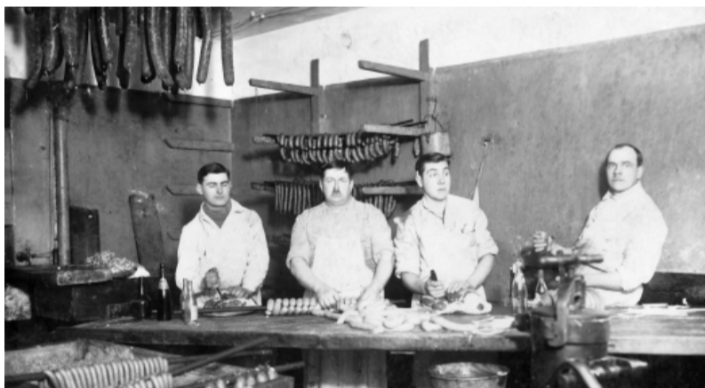
Desu darbnīca Staicelē.