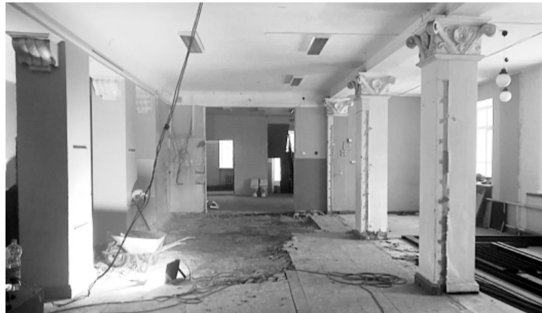
Pirmā stāva grīda bija kritiskā stāvoklī. Tagad to siltinās un ieklās flīžu grīdu.

nizētās dabaszinību, fizikas un datorzinību klases un moderna bibliotēka ar lasītavu. Tāpat uzstādīs videonovērošanas kameras, ierīkos ugunsgrēka atklāšanas sistēmu.