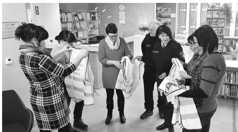
Vecāku patruļas jaunās vestes aplūko Vecāku padomju pārstāvji un likumsargi.

Vecāku patruļas mērķis ir izglītēt bērnus, jauniešus un ve-