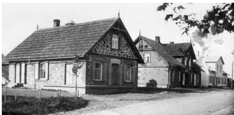
Piensaimnieku biedrības nams.

daudzas nebalts dienas; tā arī Rozēnu novadu bieži ir pārstaigājis posts un iznīcība. Pēc lielā Ziemeļu kara Rozēnu novadā bijušas vairs tikai piecas apdzīvotas mājas. Niknas kaujas notikušas arī pie tagadējās Staiceles tautskolas, ko apliecina senās kara kapenes ar tur atrastiem seniem kara ieročiem.