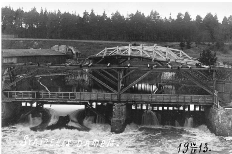
Pirmais tilts pār Salacu, saukts par Zaļo tiltu. Celts 1885. gadā.