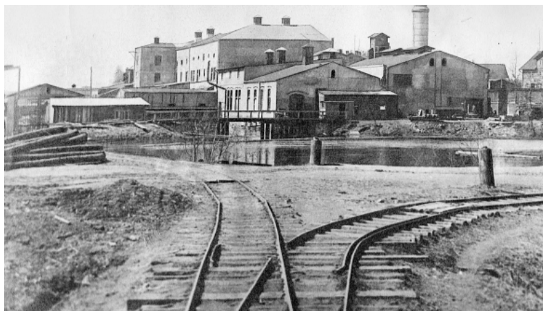
1913. gadā Staiceles papīrfabrikas vajadzībām izbūvēts šaursliežu dzelzceļš Staicele – Pāle. Slīdes fabrikas teritorijā.

gada rudenī tā jau ir uzcelta līdz ar nepieciešamām palīgēkām. Fabrika sāk darbu. Tajā pulcējas apkārtējie strādnieki, katrs grib