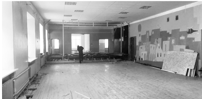
Pārmatņas skars arī 2. stāva zāle – stiprinās pirmā stāva griestus un ieklās jaunu grīdas segumu.

Pēc pārbūves izglītības iestāde piedzīvos pamatīgas pārmaiņas. Pilnībā tiks nomainīta apkures sistēma, kanalizācijas un ūdensvadu iekšējie tīkli, tāpat elektroinstalācija, tostarp uzstādīs LED apgaismojumu. Vides pieejamības nodrošināšanai skolēniem ar funkcionāliem traucējumiem, skolā uzstādīs liftu. Pilnībā nomainīs 1. stāva grīdas segumu, tostarp ieklās siltumizolāciju un hidroizolāciju, stiprinās 2. stāva grīdas ar sijām, siltinās bēniņus, mainīs iekšdurvis, mainīs visu iekšējo apdari, tajā skaitā sienas un griestus. Būtisks jaunums būs moder-