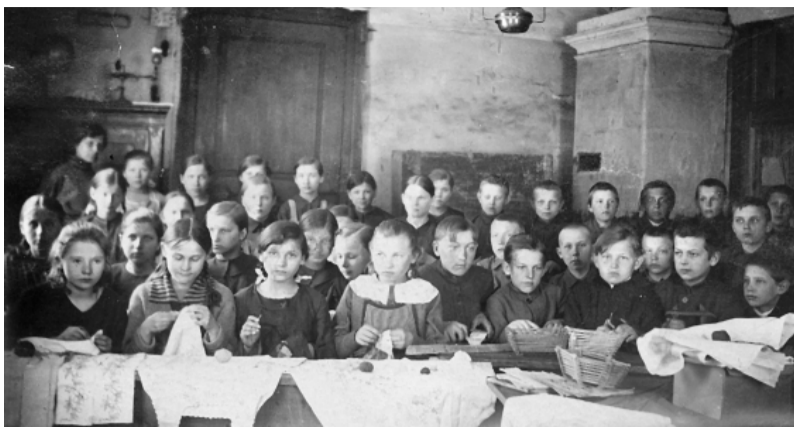
Staiceles apkārtnes bērni apgūst zinības.

Bija nodibinājusies Baltijas papīru un papes akciju sabiedrība ar 350 000 rubļu lielu pamatkapitālu. Sabiedrības dibināšanas