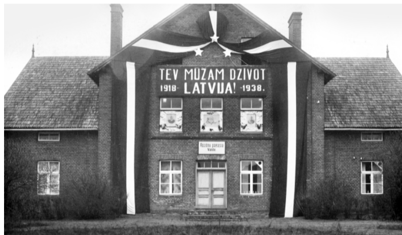
Rozēnu pagasta nams Staicelē, celts 1905. gadā. Tagad šajā vietā Staiceles kultūras nams.