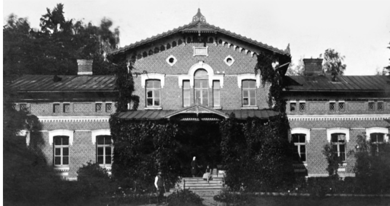
Viķu muiža, 20. gs. sākumā.

Kā jau daudzi mūsu novadi laika ritējumā ir pieredzējuši