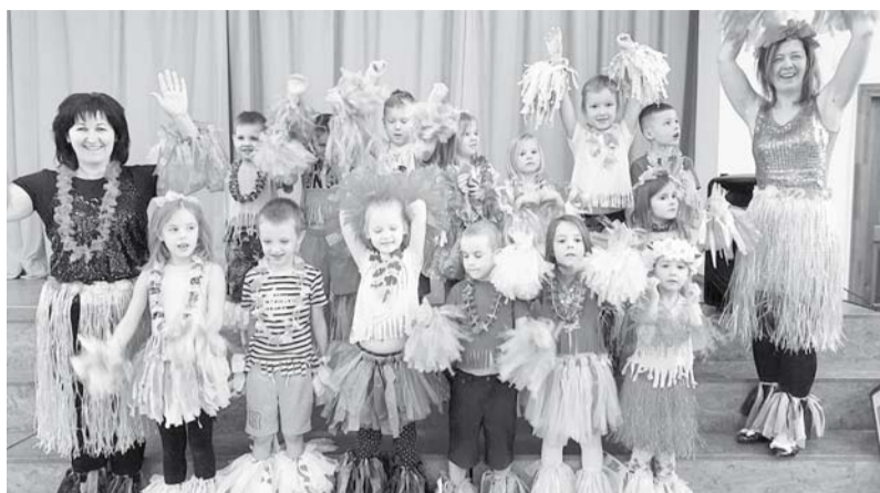
PII „Auseklītis” grupiņas Bītiķes audzēkņi un viņu skolotājas krāšņos, pašu darinātos karnevāla tērpos Vilzēnu tautas namā.

Lietainā un drēgnā 28. februāra pēcpusdienā PII „Auseklītis” bērni un viņu vecāki satikās