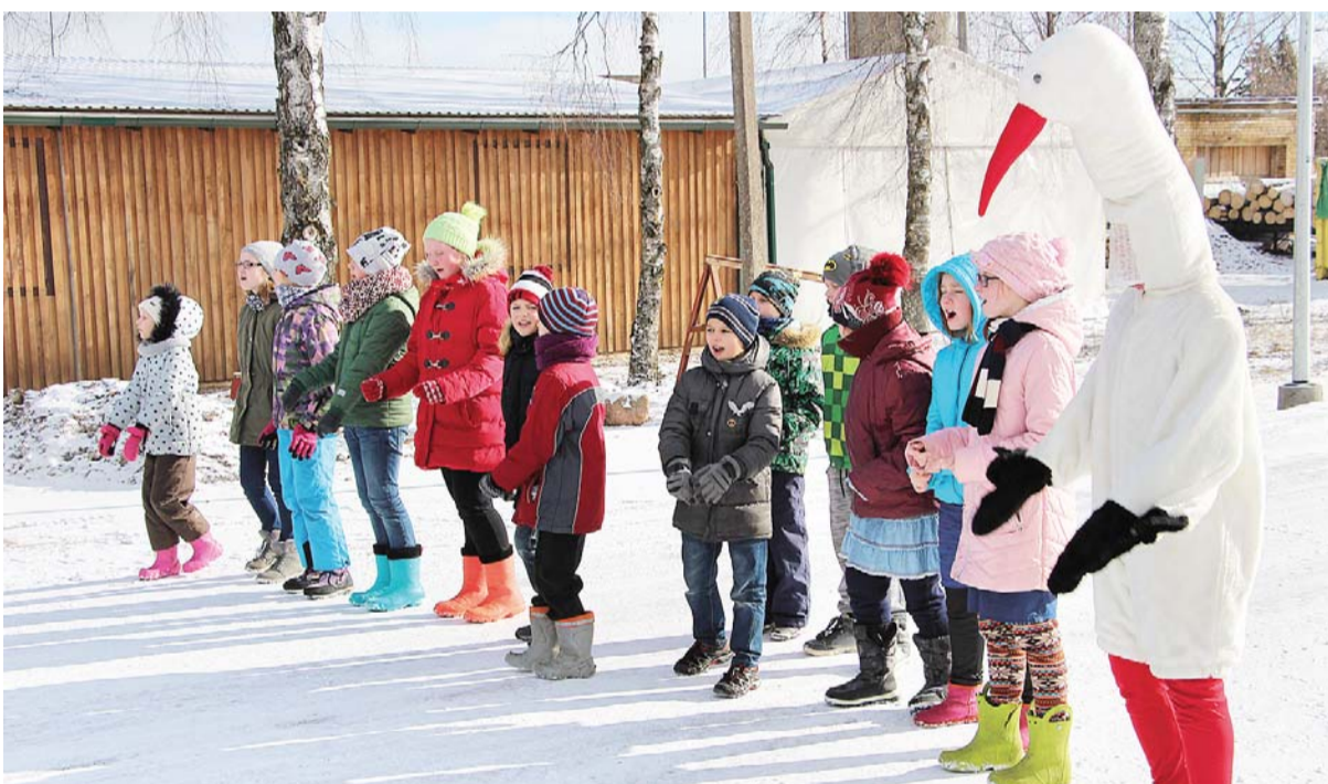
Staiceles pamatskolas skolēni kopā ar Profesoru Stārķi muzikālā un sportiskā priekšnesumā aicināja sanākušos vingrot.