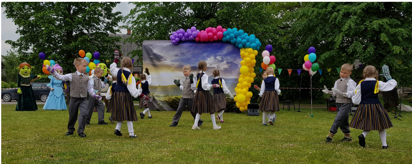
Koncerts iesākās ar Lēdurgas kultūras nama bērnu kolektīvu uzstāšanos

Maija pēdējā sestdienā nu jau par tradīciju kļuvis pasākums, kad savus svētkus svin Lēdurgas pagasta bērni. Tā arī šogad 25. maijā kultūras nama pagalmā pulcējās bērni, kas visu gadu ir cītīgi dejujuši, dziedājuši, spēlējuši mūzikas instrumentus.