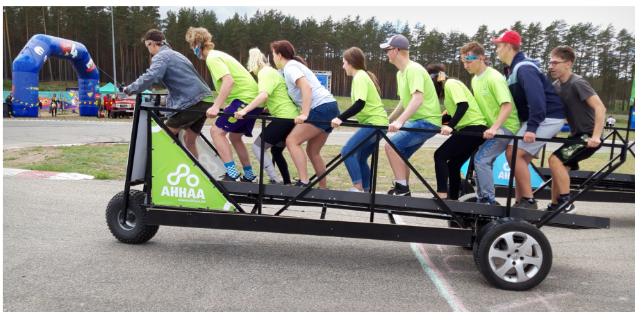
Komandas saliedētību prasīja kopbrauciens ar lielajiem ratiem