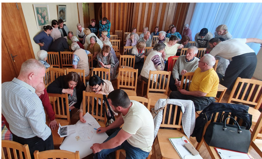
Spraigi rit darbs iedzīvotāju grupās pie ideju izstrādes ciema labiekārtošanai