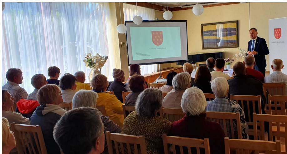
Sabiedriskās apspriešanas organizētāji bija patīkami pārsteigti par iedzīvotāju ieinteresētību un aktivitāti

Ierosināmie jautājumi tālākai diskusijai: pirmais jautājums par bijušās katlu mājas ēkas izmantošanu, kur varētu izveidot tel-