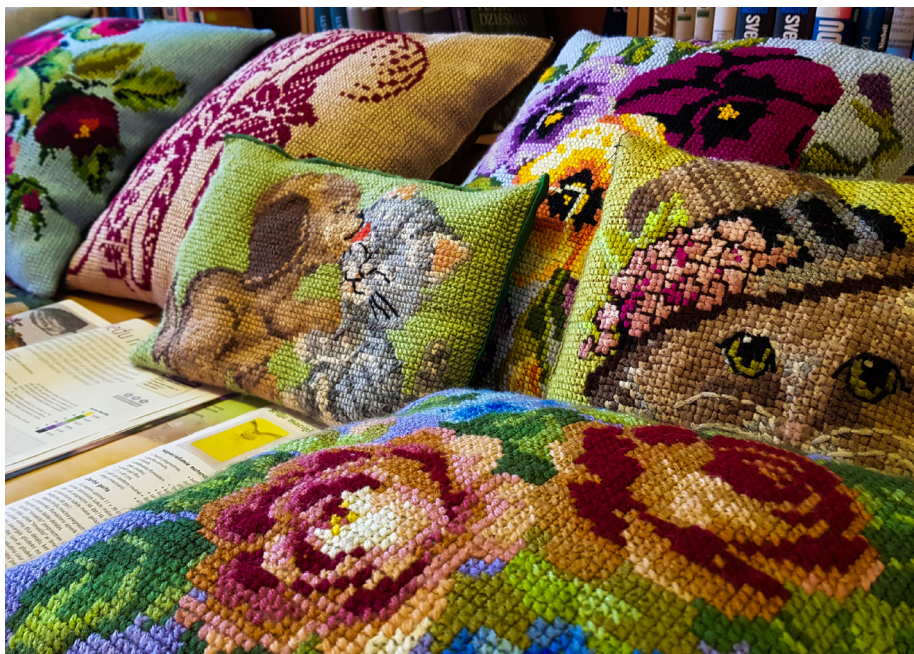
Izšūšana krustdūrienā ir aizraujošs brīvā laika pavadīšanas veids

Aicinu arī citus lēdurdziešus un viņu draugus iepazīstināt ar saviem vaļaspriekiem un kopīgi veidosim izstādi. Jebkurš