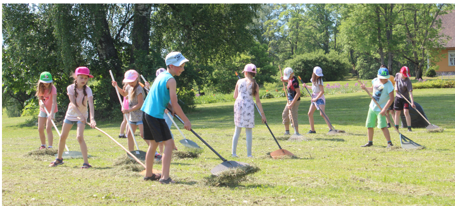
Bērni ieguva jaunas zināšanas, bagātināja pieredzi par dabu un līdzdarbojās arī praktiski.