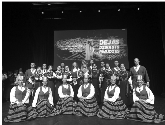
Liene ar "Zeperu" dejotājiem 2. marta koncertā Cēsīs

Šobrīd ļoti strauji aug tieši vidējās paaudzes kolektīvu skaits. Tas it kā ir