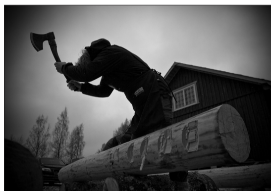
Koka tēšana ar tēšamo cirvi.