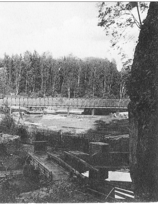
ma gados.

stražņiki ievainoti, un viens zirgs nošauts. Naudu, kuru kasieris vedis algas izmaksāšanai strādniekiem, uzbrucēji nepaguvuši nolaupīt. Ļaundari aizbēguši. Viens no ievainotajiem stražņikiem drīz nomiris.