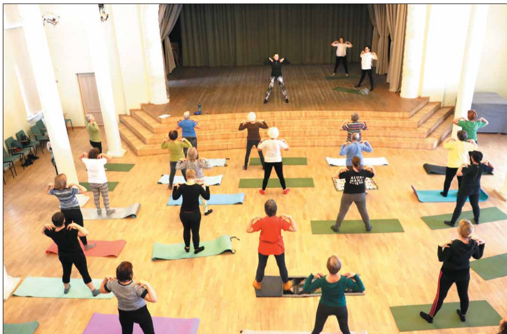
Pirmās ārstnieciskās vingrošanas nodarbības dalībnieki

Nodarbībās tiek veikti muskuļus spēcinoši un stiepjoši vingrojumi un tehnikas, mīksto ausu tehnikas un locītavu mobilizācijas, līdzsvara un koordināciju treniņi, tādēļ tie piemēroti arī cilvēkiem ar veselības problēmām.