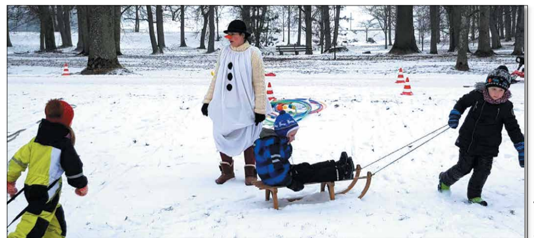
Sniega diena PII „Vecauce”