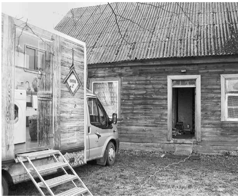
"Latvijas Samariešu apvienības" devīze ir "Palīdzēt dzīvot"; organizācija kompetencē ir veselības aprūpe, sociālā un izglītības joma.

Pieprasīts ir arī mobilās aprūpes pakalpojums ar lielo, īpaši šīm vajadzībām būvēto automašīnu – cilvēki labprāt izmanto iespēju nomazgāties dušā, sakopt kāju pēdas un nagus, ko nodrošina pēdu aprūpes speciālists, izmazgāt veļu, nogriezt matus. Mobilās aprūpes auto ik mēnesi dodas pie 50 cilvēkiem. "Šis pakalpojums ir izveidots tā, lai tie cilvēki, kuri dzīvo laukos, kuriem nav pieejamas ērtības un ir grūtības pašiem sevi pilnvērtīgi apkopt, varētu droši palikt savās mājās un dzīvot pilnvērtīgu dzī-