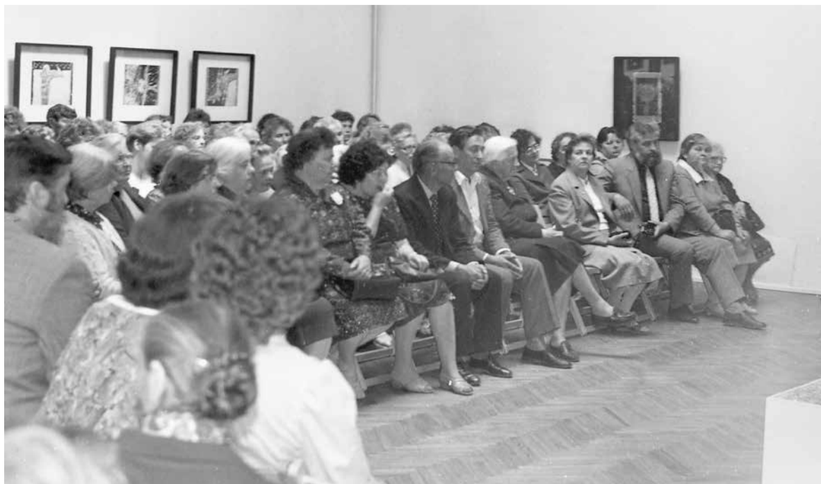
Represētie pirmoreiz aicināti Madonas muzejā. 1989. gada 11. jūnijs.

1988. gada 25. martā pirmo reizi okupētajā Latvijā ar varas iestāžu atļauju Rīgā, Brāļu kapos, piemin deportācijas upurus un pie Mātes tēla noliek ziedus. Milicija apsargā Brīvības pieminekli, kur ziedu nolikšana ir aizliegta. Latvijas PSR Ministru Padomes 1988. gada 2. novembra lēmums Nr. 350 atzīst "Par pilsoņu nepamatotu administratīvu izsūtīšanu no Latvijas PSR 1949. gadā". Aizsākas plašāka izsūtīto apzināšana, atmiņu dokumentēšana un materiālu vākšana. 1989. gada 11. februārī Latvijas Tautas frontes (LTF) Madonas rajona nodaļa, Madonas Novadpētniecības un mākslas muzejs un Madonas kultūras nams organizē pirmo represēto sanākšanu kultūras namā. Par tradīciju ir kļuvusi arī represēto pulcēšanās Madonas Novadpētniecības un mākslas muzejā. Arī šogad, 29. martā, aicināsim represētos uz tikšanos muzejā. Bet viņus pirmoreiz pulcināja muzeja svētdie-