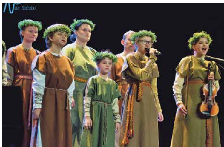
Vokālais ansamblis "Mazais cilvēciņš".

Šis gads biedrībai "Mēs saviem bērniem" uzsācies ar spraigu darbu, jo bija jāgatavojas kārtējam Reģionālajam integratīvās mākslas festivālam „Nāc līdzās”.