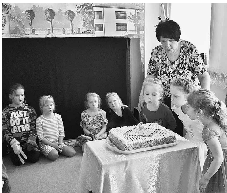
Jubilejas tortes svecītes nopūš skoliņas “absolventes”.

Varbūt kādam šķitīs, ko skoliņā mazuļi var darīt un vai tiešām viņi tur arī mācās? Jā, viņi mācās – komunicēt savā starpā, iepazīties ar citu vidi, sabiedrību un piedalīties pasākumos, bet galvenās ieguvējas ir mammas, kuras caur tik dažādajām nodarbībām un lekcijām iepazīst savu mazuli. Viņas šeit atrod idejas un iedvesmu, kā padarīt labāku ikdienu kopā ar bērniņu. Ir reizes, kad māmiņas, pavadoot dienas ar mazuli, jūtas vienuļas, jo ģimenes locekļi ir aizņemti darbos. Tādos mirkļos pat gājiens uz veikalu var kļūt par notikumu. Šāda darbošanās kopā māmiņas satuvina