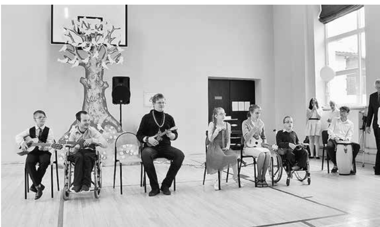
Ar vislabākajiem priekšnesumiem skolēni iepriecina Mātes dienā.

nāšanas un slimību profilakses pasākumu īstenošana Madonas novada iedzīvotājiem" ietvaros skolā būs tikšanās ar podologu un uztura speciālistu, tiks zīmētas spēles uz as-