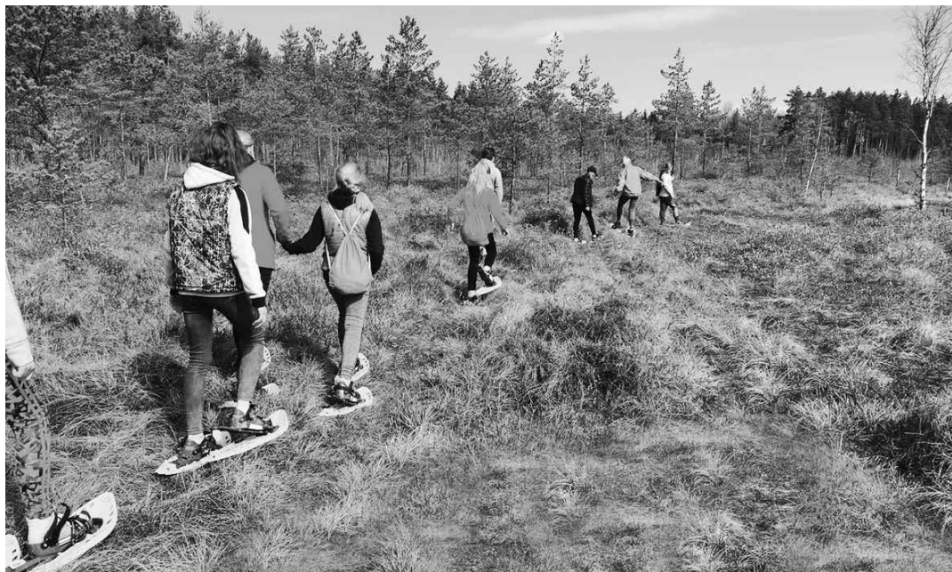
Pastaiga Teirumnieku purvā ar speciālajām purva korpēm.

Šķiet, vēl nesen, februārī, biedrība „Pauze AD”, kuras sastāvā pārsvarā ir jaunieši sāka realizēt projektu „Dod roku, kāpjam augstāk!” ar līguma Nr. MNP/2.4.3./18/178