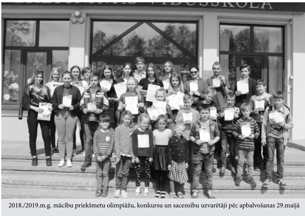
2018./2019.m.g. mācību priekšmetu olimpiāžu, konkursu un sacensību uzvarētāji pēc apbalvošanas 29.maijā