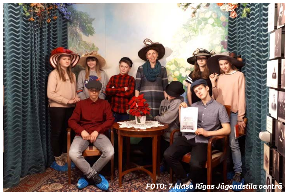
FOTO: 7.klase Rīgas Jūgendstila centrā

Mākslas skolas Jaunais gads raiti ievirzījies audzēkņus dažādās aktivitātēs. Valsts konkursa 1. kārtas ietvaros māksliniecišķi dokumentējam dažādu dabas objektu formu, krāsu, materialitātes pētīšanu. Esam vākuši un dažādi attēlojuši augus, izmantojuši tos jaunu lietu izgatavošanā, gleznojuši ar augļu un dārzeņu sulām, vērojuši pigmentu izmaiņas laika gaitā. Šī tēma nedaudz ir iepazīstinājusi skolēnus ar laikmetīga mākslinieka domāšanu un darba metodēm.