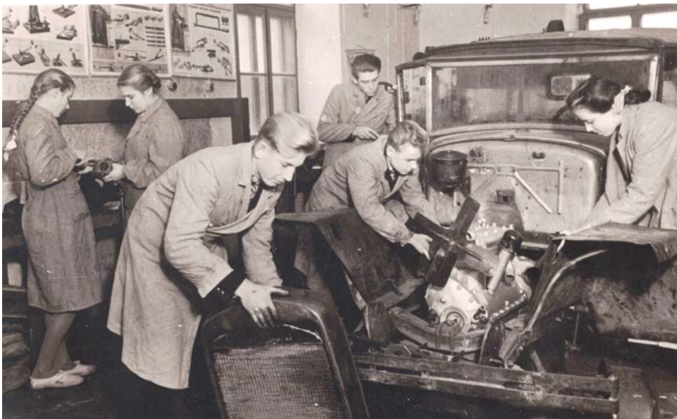
1958./1959. m.g. Auto pulciņa nodarbības. Remontē skolas automašīnu