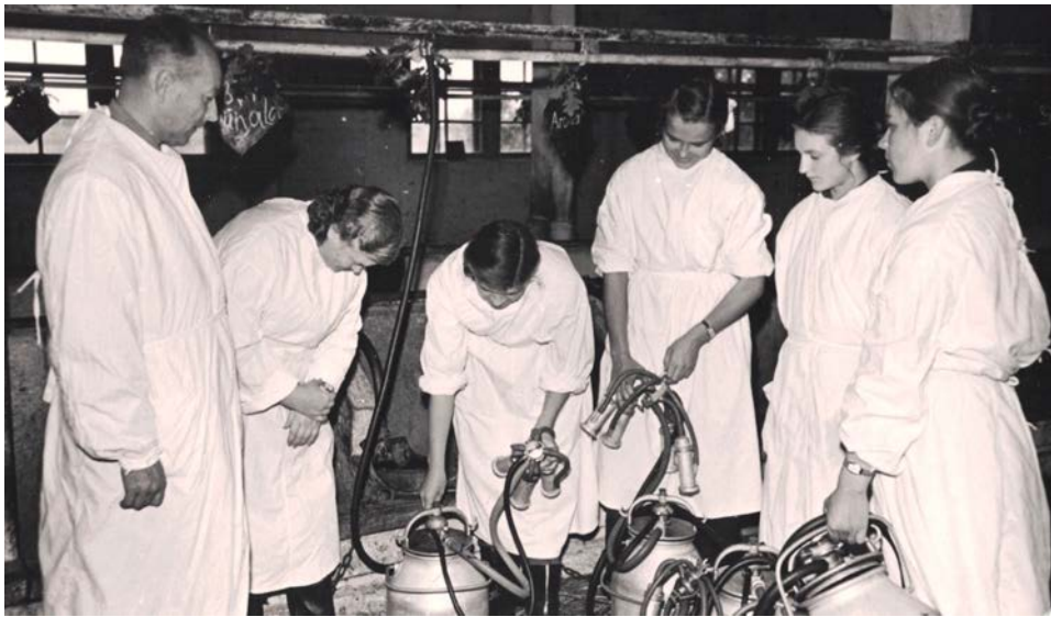
1960./1961. m.g. Skolotāji un skolēni darbā Tīšu fermā