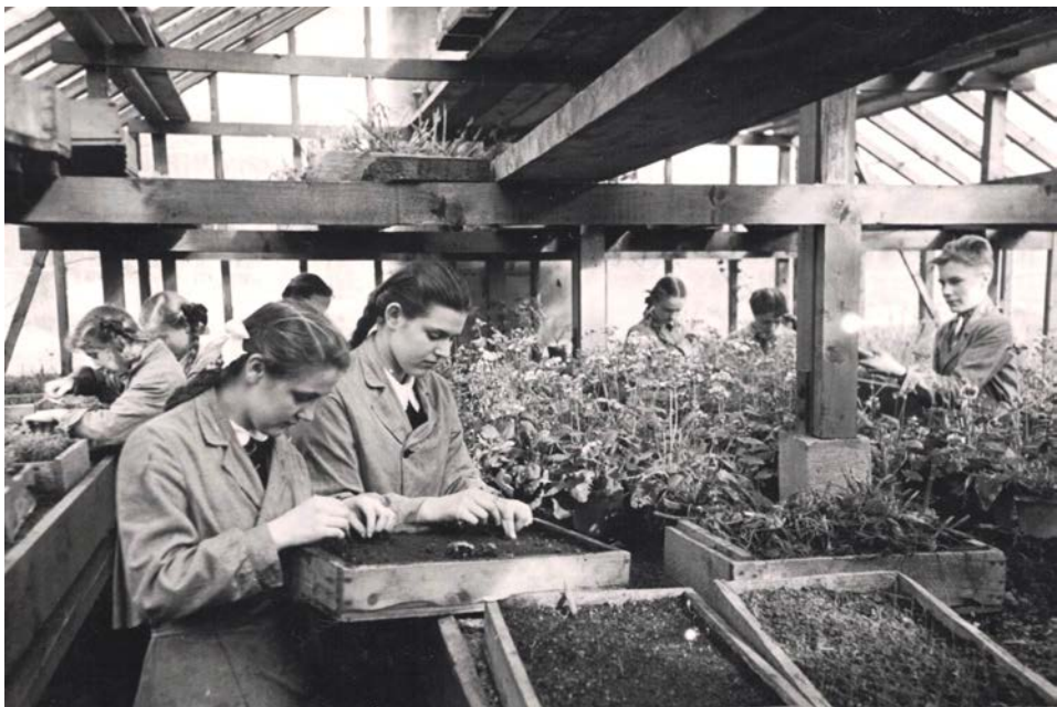
1959. gads. Skolēnu darbs skolas siltumnīcā