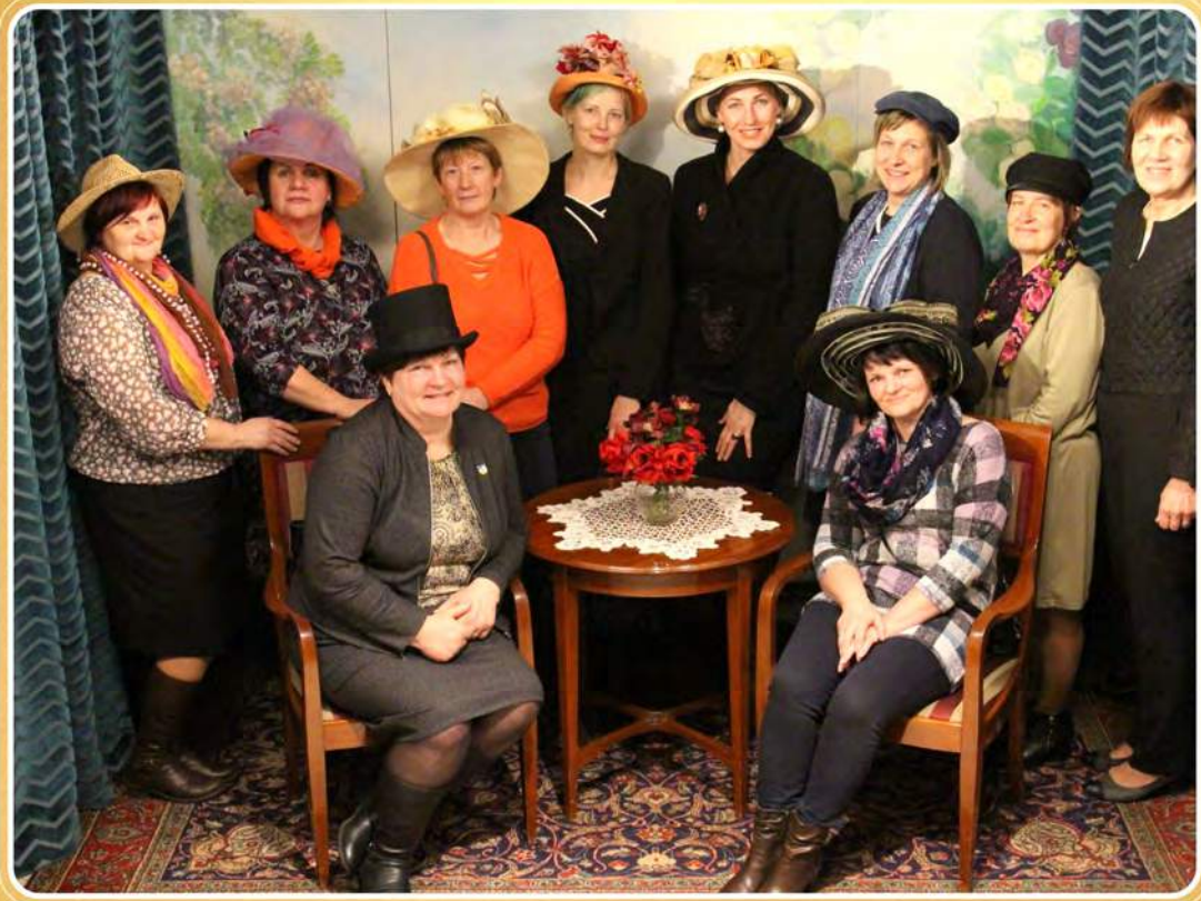
RĪGAS JŪGENDSTILA CENTRS • RĪGA ART NOUVĒAU CENTRE

2019. gada 8. martā gan Mazsalacā, gan Rīgā tika atzīmēta mūsu novadnieka, ievērojamā arhitekta Konstantīna Pēkšēna 160 gadu jubileja. Ramatas pagasta Nuķu pusmuižā dzimis un bērnību pavadījis viens no visu laiku ievērojamākiem latviešu arhitektiem Konstantīns Pēkšēns (1859-1928), kura projektētos daudzstāvu mūra namus un koka ēkas varam apskatīt ne tikai Rīgā, bet vairākās Latvijas pilsētās. Rīgā vien pēc viņa projektiem eklektisma formā un racionālā jūgendstila formā uzceltas vairāk nekā 250 ēkas.