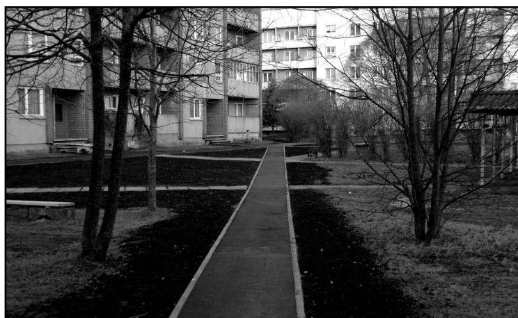
Celtnieku ielas iedzīvotāji priecājas par ierīkotajiem gājēju celiņiem.