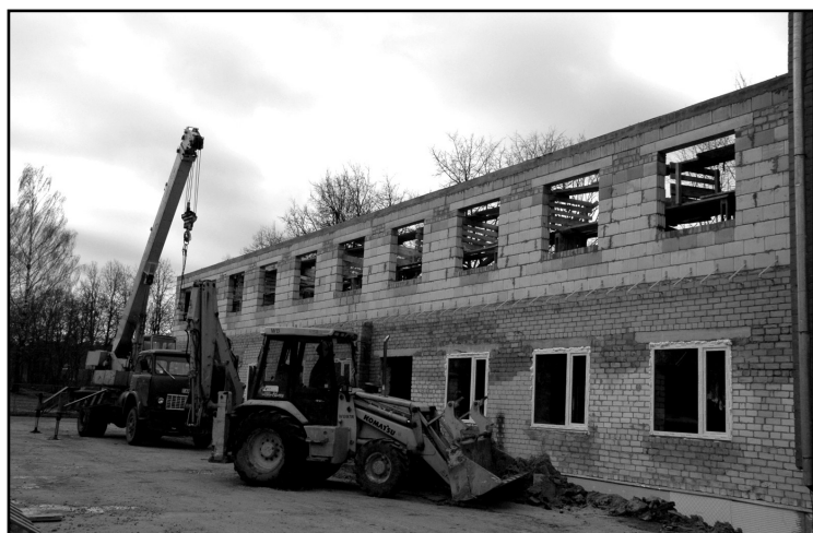
Top ģimnāzijas mājturības kabinets.