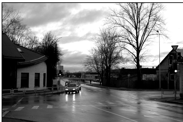
Rekonstruētais Brīvības un Vienības ielas krustojums tagad ir plašs un labi pārskatāms.