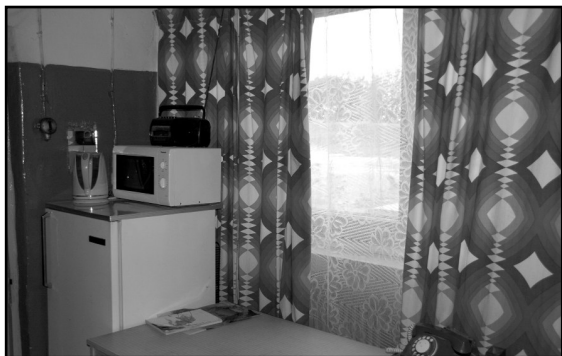
Personāla telpa Celtnieku ielas katlumājā. Siltumtīklu vadība kopā ar arodbiedrību rūpējas, lai strādājošie vienpadsmit stundu garajā darba cēlienā varētu ieturēt siltu maltīti un vaļas brīdī atpūsties. Darbinieku vajadzībām iegādātas mikroviļņu krāsnis un tējkannas. Ledusskapi gan uz darbavietu esot atgādājuši paši strādājošie.