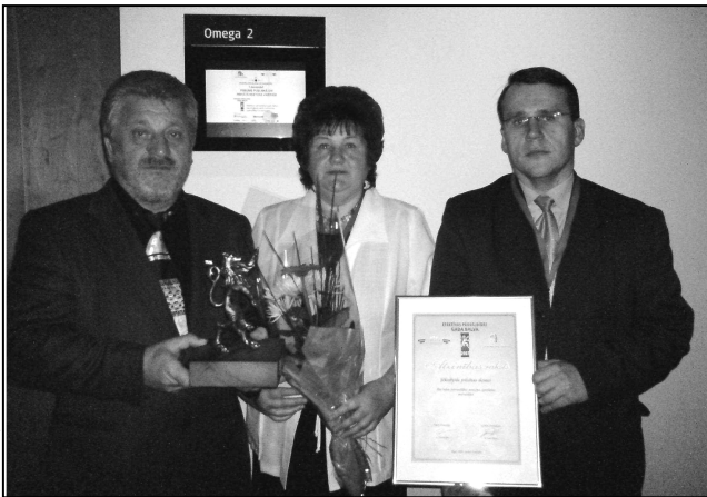
Ir liels gandarījums par iegūto balvu.

Portāla www.jekabpils.lv sadaļā „Elektroniskie pakalpojumi iedzīvotā-