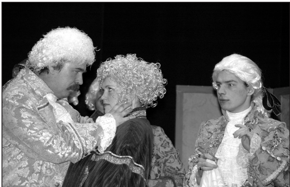
A. Eglītes "Kazanovas mētelis" Lielvārdes Tautas teātris