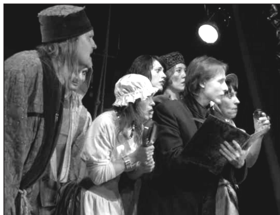
Ž.B.Moljērs „Skopulis” - Jūrmalas teātris