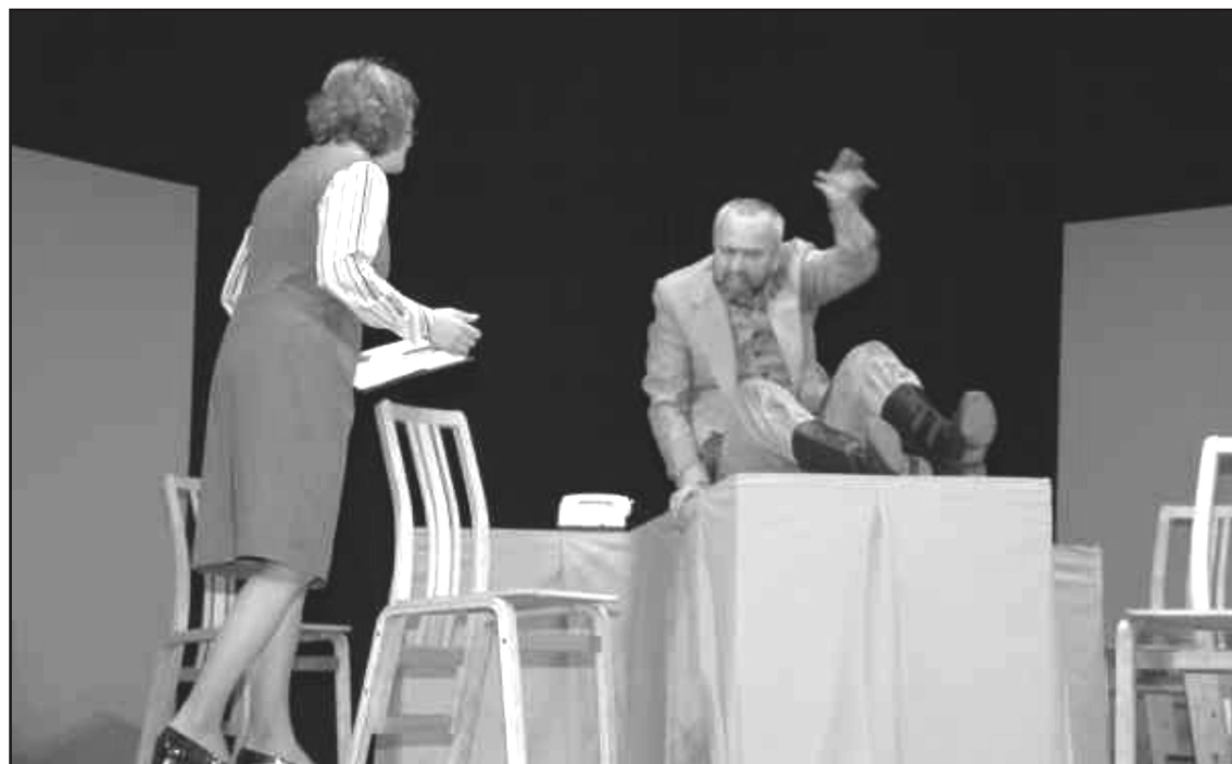
A. Eglītis “Karmen, Karmen” U. Sedlenieka TT “Sliexsnis”