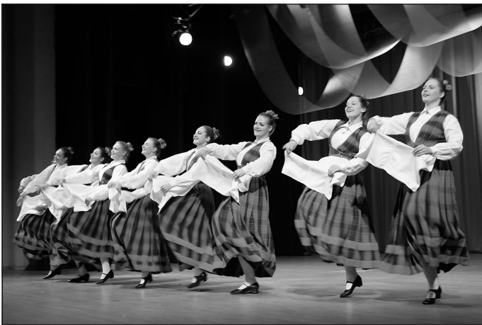
Deju kopa “Māra”