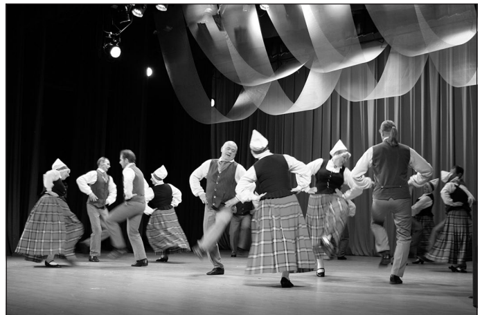
Deju kopa “Kniediņš”

Paldies, mīlie Mālpils dejotāji, ka jūs esat mums un Latvijai!