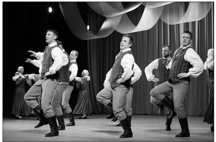
Deju kopa “Sidgunda”