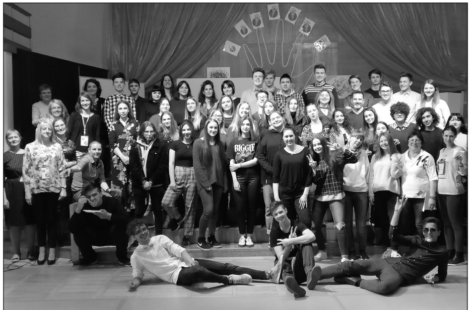
6) Visi kopā noslēguma pasākumā

Projekta starptautiskie pasākumi līdž ar to ir noslēgušies, bet iepriekš minētajās anketās skolēni ir nosaukuši arī vairākas jaunas idejas, ko vēl varam paspēt īstenot tepat skolā līdž mācību gada beigām, kopīgi veidojot radoši moti-