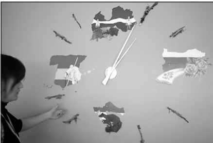
5) ...un pulksteņi, kura ciparnīca apvieno visas partnerskolas

spēj būt prom no mājām un kā tu reaģē krīzes situācijās. Dalība projektos palīdz attīstīt kritisko domāšanu, un reizēm tas arī var būt spriedzes tests, kurā tu esi spiests meklēt kompromisus un komunicēt ar PILNĪGI svešiem cilvēkiem. Izveidotās draudzības saiknes ir nenovērtējams ieguvums no dalības ārzemju projektos."