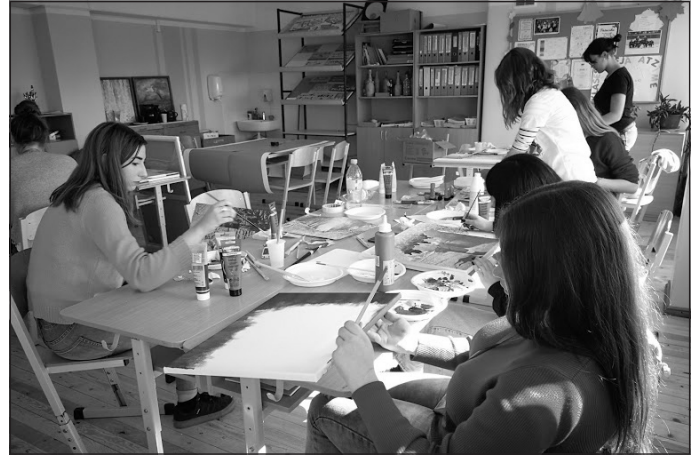
2) ...ilustrēja teiku par Mergupi...