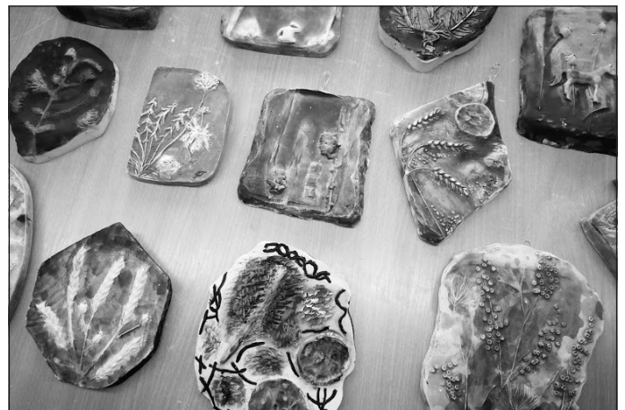
4) izveidoja dekorus ar dažādiem Latvijas un citu valstu augiem...