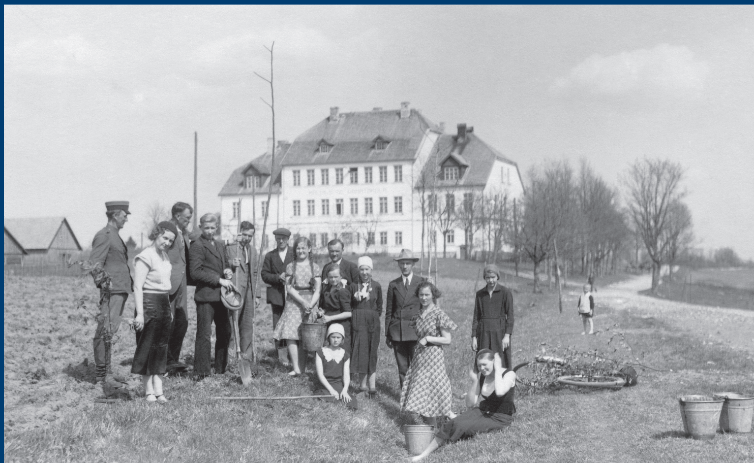
Mežu dienas Mālpilī pie 6-klasīgās pamatskolas, ap 1929. gadu

Par pašvaldību administratīvi teritoriālo reformu