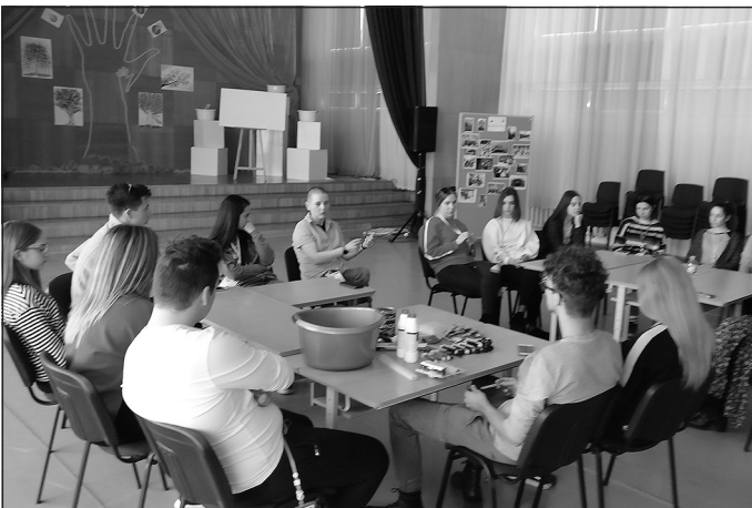
3) ... šuva mīkstās rotaļlietas un cēla tām mājas