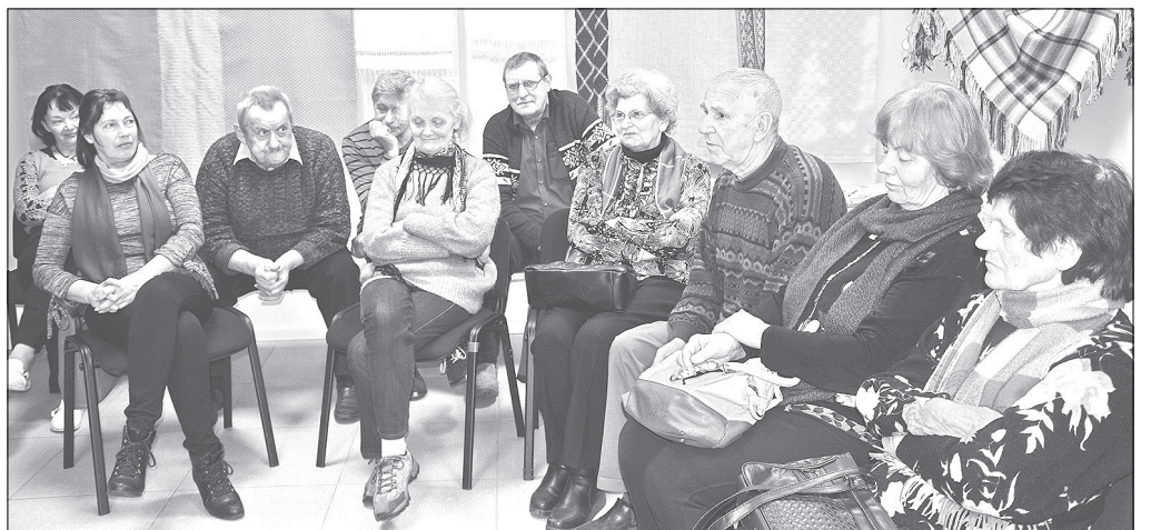
Atmiņās šajā vakarā dalījās ikviens klātesošais, aktīvi papildinot Bergāna kunga stāstījumu.