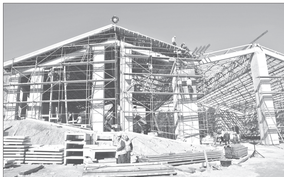
Estrāde varēs uzņemt 2000 skatītāju – 1000 sēdvietās un 1000 stāvvietās.

Par tikšanos ar dabas pētnieku lasiet 3. lpp.