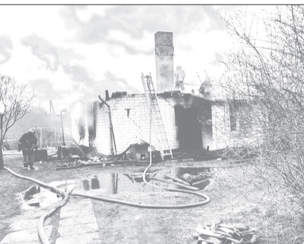
Pēc notikušā ugunsgrēka māja vairs nav atjaunojama. Albuma foto

Kad mūsu iestādes dziedāšanas svētki bija noslēgušies, pirmajā pavasara dienā sagaidījām ciemiņus – Rojas pirmsskolas grupiņas „Pūci-