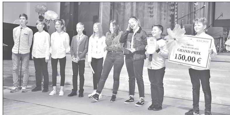
„Grand Prix” ieguvējai, grupas „Rock Teen” meitenēm bija grūti valdīt prieka asaras.