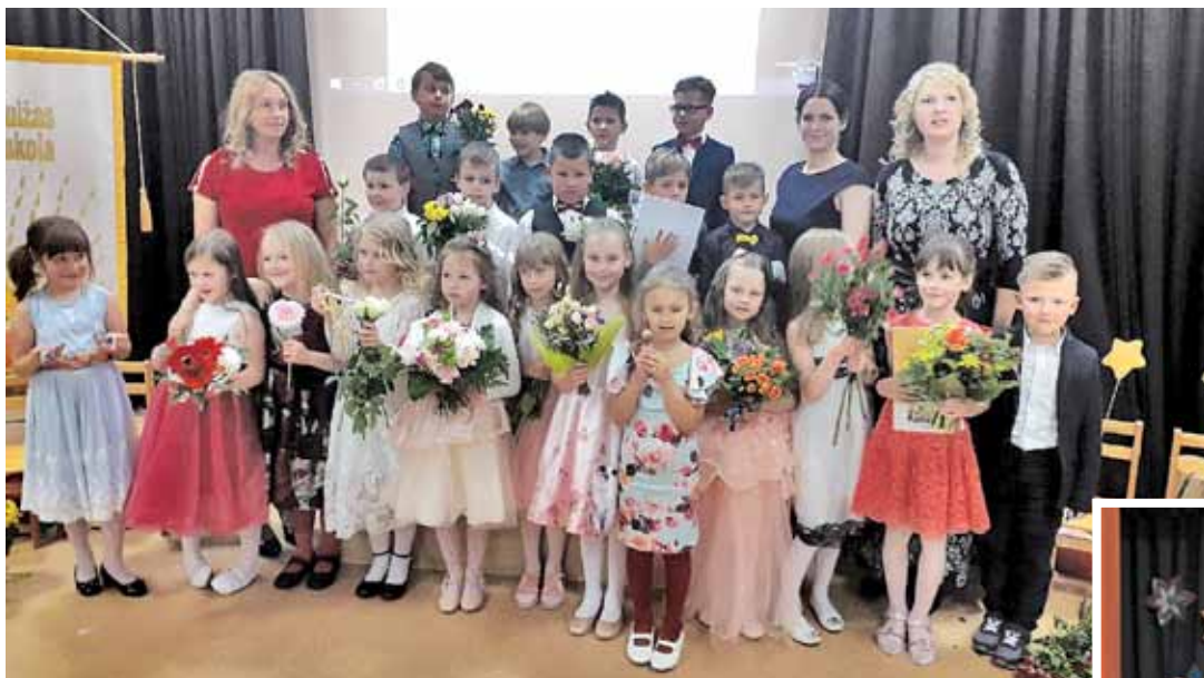
Zaķumuižas pamatskolas pirmsskolas izglītības grupas „Sprīdīši” audzēkņu izlaidums.