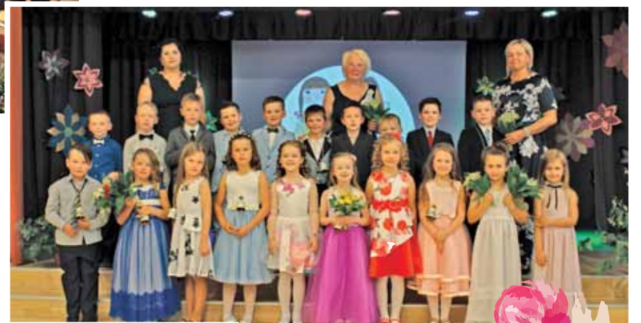
PII „Annele” pirmsskolas izglītības grupas „Kriksiši” audzēkņu izlaidums.