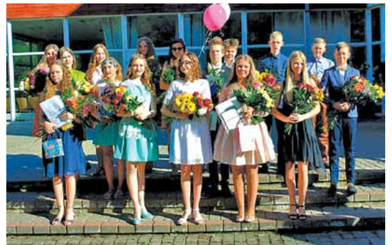
Mūzikas un mākslas skolas „Rodenpois” audzēkņu izlaidums.