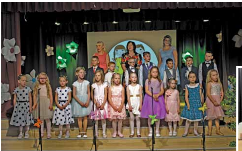
PII „Annele” pirmsskolas izglītības grupas „Kārumnieki” audzēkņu izlaidums.