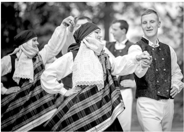
Projektā sarūpētie Rucavas tautu tērpi.