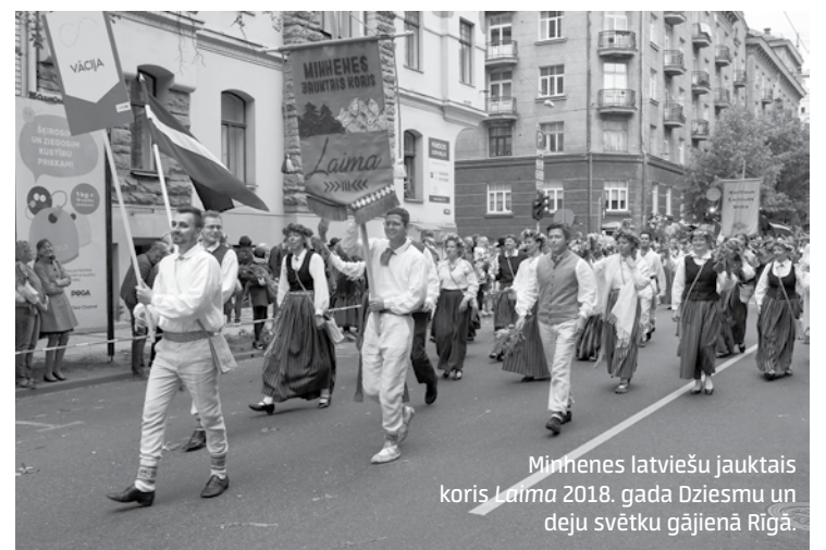
Minhenes latviešu jauktais koris Laima 2018. gada Dziesmu un deju svētku gājienā Rīgā.

Lāsma Reimane Diānas Zaveles arhīva foto