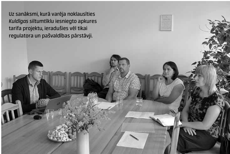
Uz sanākumi, kurā varēja noklausīties Kuldīgas siltumtīklu iesniegto apkures tarifa projektu, ieradušies vēl tikai regulatora un pašvaldības pārstāvji.

Apjoms audzis kopš 2016. gada, kad KS pārņēma katlumājas ārpus pilsētas. No tām lielākais patēriņš ir Priedainē (pērn gandrīz 2500 MWh gadā), citur tiek patērēts līdz tūkstošiem. Savukārt pilsētā pa abām katlumājām kopā – gandrīz 32 500 MWh.