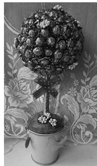
Zieds no konfektēm.

Kristīne rokdarbos gūstot mieru. „Parasti cilvēki mani meklē uz Valentīna dienu, Māmiņdienu un Ziemassvētkiem, jo vēlas sev tuvos sveikt ar pašdarinātu dāvanu. Kad pasūtījumi ilgāku laiku nav bijuši, man parādās nemiers – sāku domāt, ar ko papildināt mājas interjeru. Ja kādam draugu lokā vai ģimenē tuvojas svētki, izplānoju interesantu vai humoristisku dāvanu. Atceros, ka vienam draugam