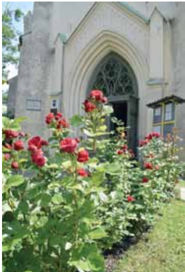
Pie Kuldīgas Sv. Katrīnas baznīcas leknī zied sarkani ziedi.