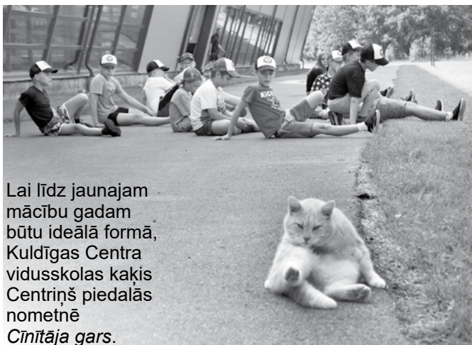
Lai līdz jaunajam mācību gadam būtu ideālā formā, Kuldīgas Centra vidusskolas kaķis Centriņš piedalās cīnītāja gars.

Bet tā paliek katra paša izvēle – dzīvot savā komforta burbulī vai izlauzties no tā. Tas nozīmē mainīties, paplašināt redzeslokus un spēt ieklausīties citādajā un citādajos. Varbūt pat būt labākam, pārvarot savus aizspriedumus. Sevi pārvarēt nozīmē izlauzties no ierastā, lai cik grūti tas arī būtu.