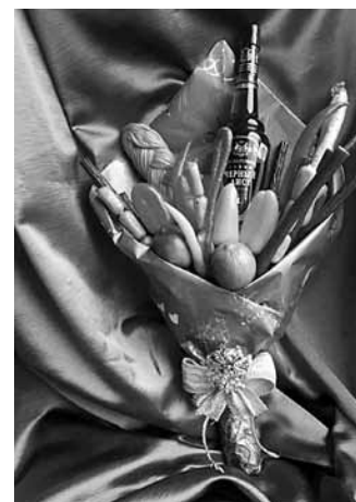
Viena no interesantākajām dāvanām - pušķis, kurš sastāv no dažādām gaļas izlasēm, čili pipara, laima, dažādiem sieriem un alkohola pudeles.

„Visbiežāk taisu rokdarbus ar saldumiem. Nezinu, kādēļ, bet pie manis vēršas tie, kuri vēlas pasūtīt ēdamas dāvanas. Tās ir konfekšu pušķi, konfekšu koki, esmu veidojusi arī kuģi. Cilvēku interesē arī pieaugušo pušķi, kuros ietilpst alkohola pudele. Biju priedīga, saņemot pasūtījumu no kādas sievietes, kura vēlējas pušķi no dažādām gaļas izlasēm, sieriem, čili pipara, lai-