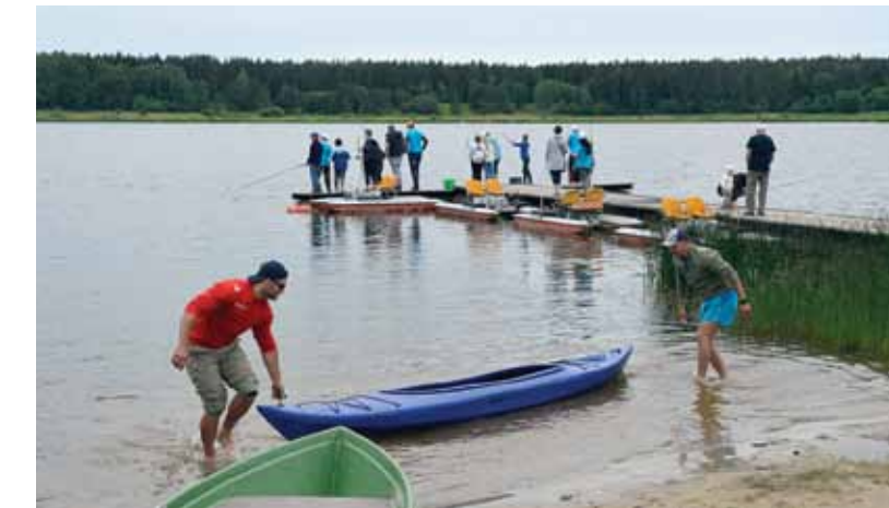
Vietējie copmaņi tin makškeres, lai netraucētu sacensties jaunajiem makšķerniekiem.