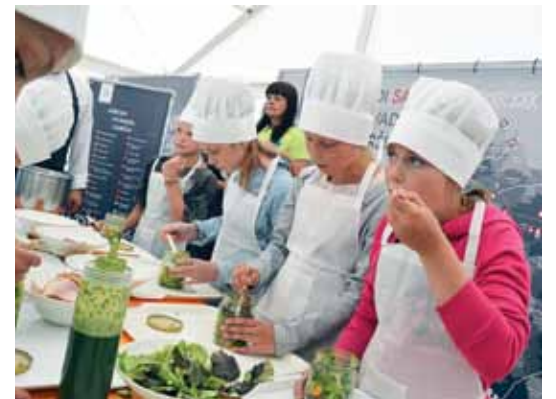
Padures un Brocēnu mazpulcēni mācās pagatavot salātus ar gurķu spageti.