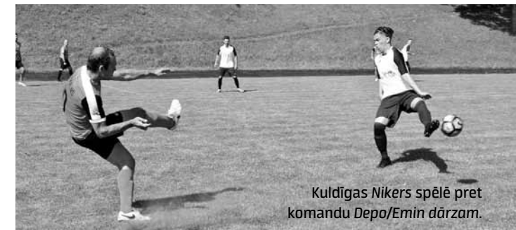
Kuldīgas Nikers spēle pret komandu Depo/Emin dārzam.