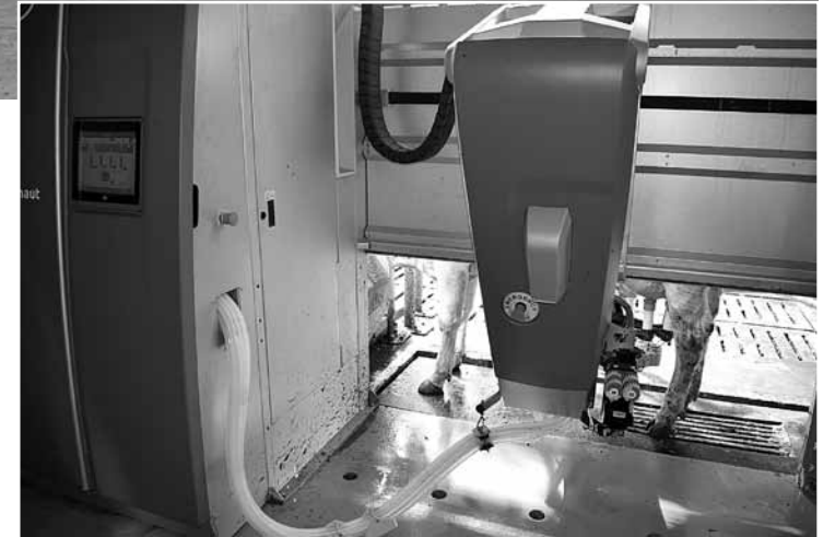
Govis slauc robots, un visa informācija parādās datora ekrānā.

„Daudzi zemnieki sacēlušī kūti un saka, ka viss ir labi, bet es saku: vislabāk govs jūtas laukā. To atzīst visi vētrā. Pašlaik tās uzturas tikai kūtī, jo tur ir vēsāk. Arī mums būs iespēja, ka tās varēs iet ārā izstaigāties. Domāju: ar laiku būs tādi noteikumi, ka