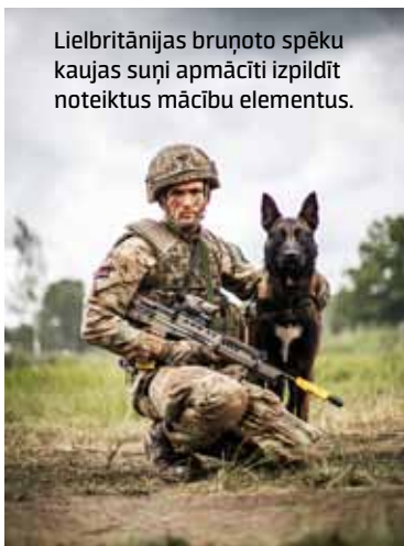
Lielbritānijas bruņoto spēku kaujas suņi apmācīti izpildīt noteiktus mācību elementus.

Mācībās Baltic Protector Latvijā piedalījās ap 300 karavīru un zemessargu no 3. Latgales