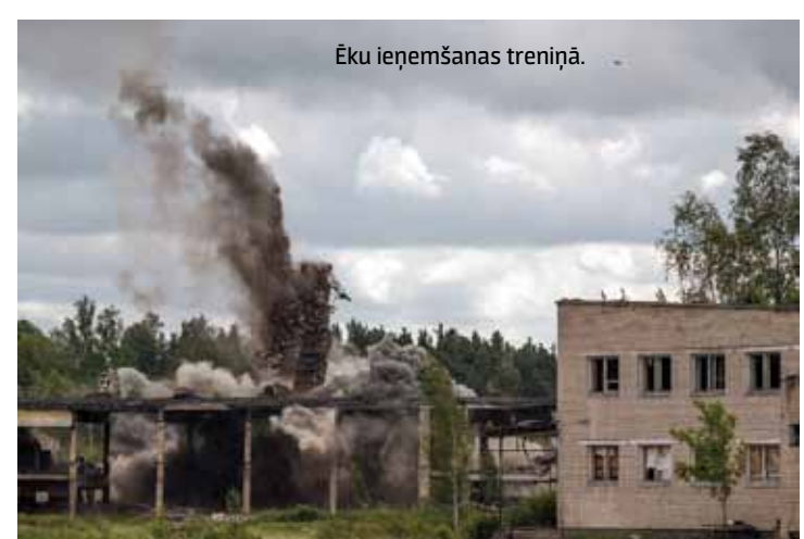
Ēku ieņemšanas treniņā.

kuģi Rēzekne , Jelgava , Varonis , Virsaitis un Imanta Baltijas valstu jūras eskadras ( Baltron ) sastāvā. Gaisa spēki mācības atbalstīja ar