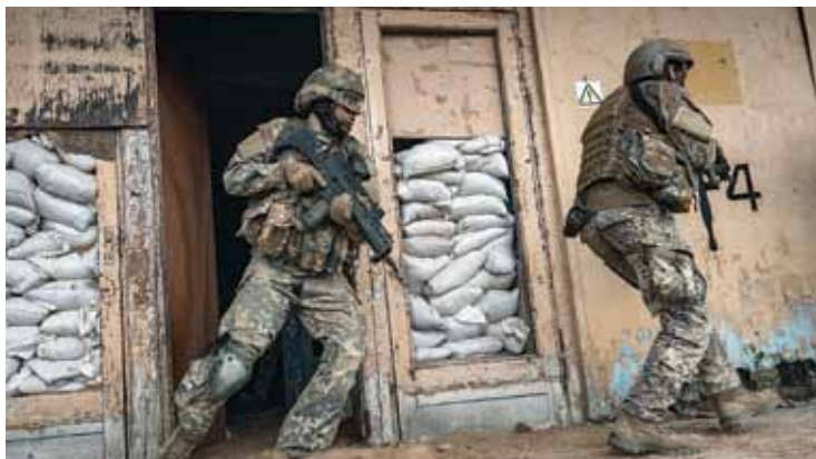
Vingrinājumu laikā latviešu un britu karavīri apliecināja bruņoto spēku sadarbību.

Notikusi arī Zemessardzes 3. Latgales brigādes 36. kaujas atbalsta bataljona rotas nacionālā sertifikācija NATO uzdevumu izpildei. Mācībās iesaistīts Lielbritānijas kaujas helikopters Apache , kas atbalstījis ar tuvo uguni. Trenēti dažādi taktikas elementi – ēku ieņemšana un aizsardzība. Viens no interesan-