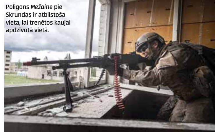
Poligons Mežaine pie Skrundas ir atbilstoša vieta, lai trenētos kaujai apdzīvotā vietā.

brigādes, 4. Kurzemes brigādes, Jūras spēkiem, Gaisa spēkiem un citām Nacionālo bruņoto spēku vienībām, kā arī Jūras spēku