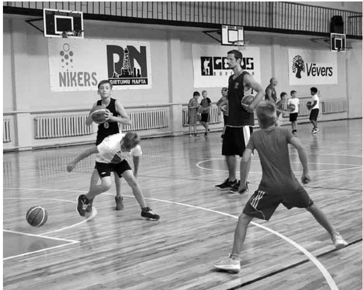
Sporta nometnes Kamolīs dalībnieki rīta pusē pilnveido tehniskās prasmes basketbolā.

Sporta nometne Kamolīs iepriekš bijusi diennakts nometne Kabilē , bet pirmo reizi sarīkota Kuldīgas sporta namā tikai pa dienu. Tajā piedalās pārsvarā basketbolisti, bet tiek iepazīti arī citi sporta veidi.