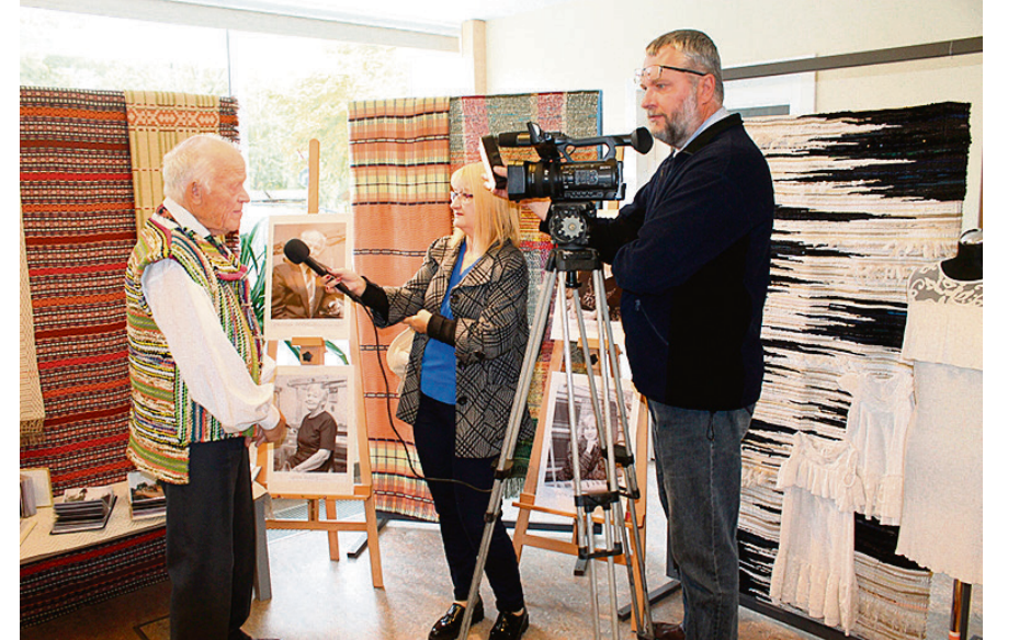
Intervija audēju kopas „Kodaļa” 55. gadadienā.