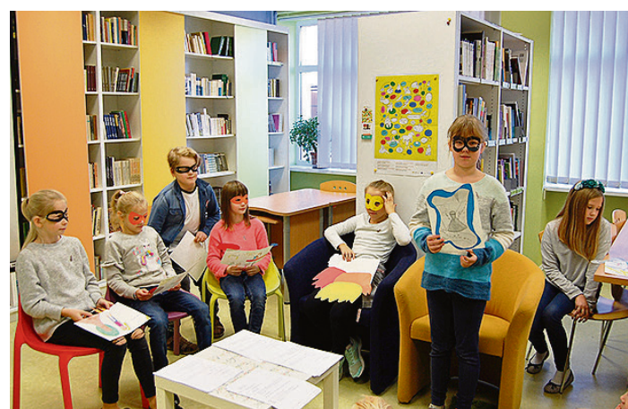
3.b klases skolēni Ziemeļvalstu literatūras nedēļā.

Dace Dulpiņa, Zvejniekciema vidusskolas bibliotēka