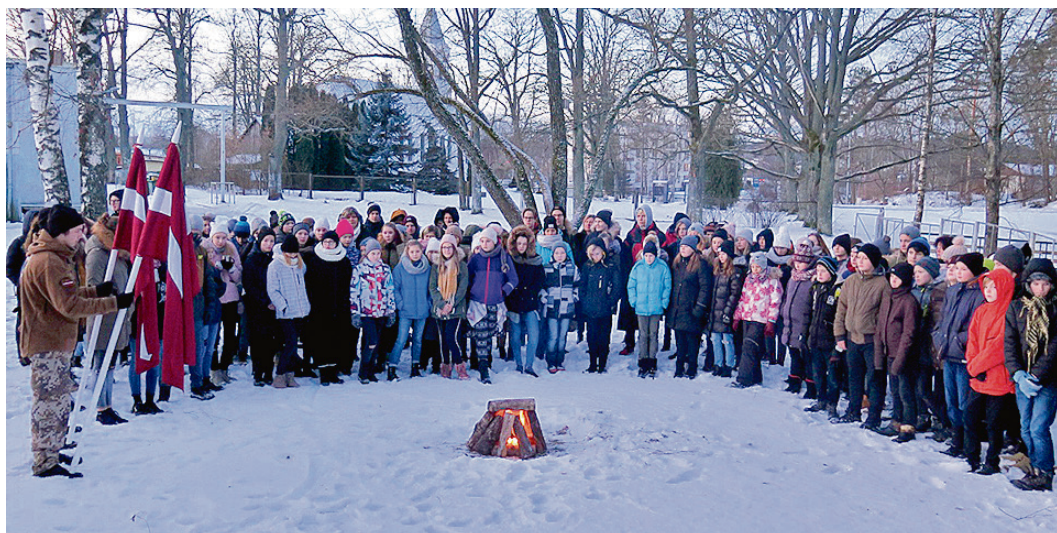
Barikāžu atceres pasākumā.

Jaunais gads Saulkrastu vidusskolā sākās interesantu, radošu, atraktīvu un čaklu cilvēku zīmē. Pirmajā gada mēnesī pie mums paspēja paviesoties vairākas spilgtas personības un padalīties ar saviem pieredzes stāstiem, un arī no pašiem skolēniem sevi pieteica mērķtiecīgākie un motivētākie audzēkņi.