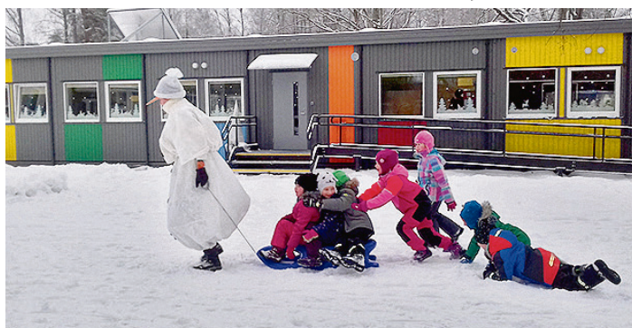
Sniega dienā kopā ar Olafu.

No 14. līdz 18. janvārim bērnu dārzā notika sniega dienas. Tika rīkotas dažādas aktivitātes: slēpošana, krāsaino bumbu šķirošana, vizināšanās ar ragavām, lielā sniega kalna celšana.