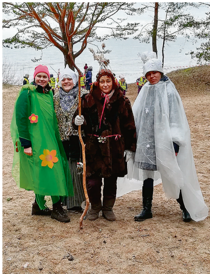
Pavasaris, saimniece, Metenis un Ziema izspēlēja Meteņu stāstu pie jūras.

No 18. līdz 22. februārim tika rīkota izstāde, kurā gan pedagogiem, gan bērniem un vecākiem bija iespēja aplūkot dažādus materiālus, suvenīrus un pat pašu bērnu gatavotus lietus par konkrēto valsti. Liels paldies vecākiem par atbalstu!