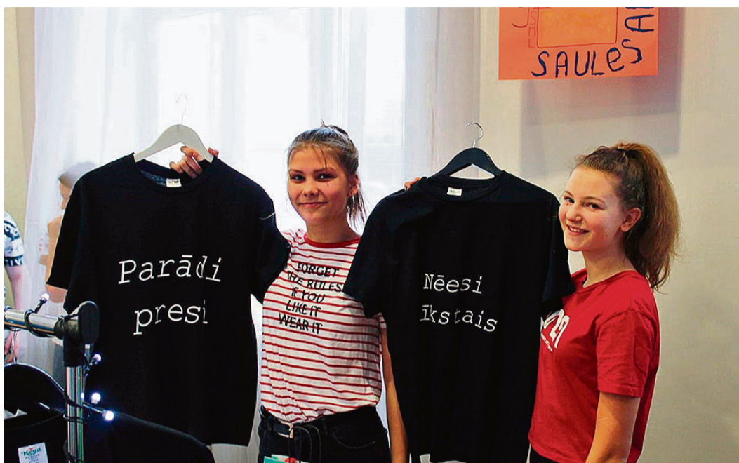
Metēdienes uzņēmējdarbības ideju izstādē.

Pagājušajā mēnesī skolēni īpaši aktīvi apmeklēja arī dažādus kultūras pasākumus. Ar programmas „Skolas soma” atbalstu Saulkrastu vidusskolas dažāda vecuma skolēniem bija iespēja apmeklēt