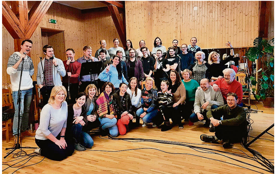
Radošais kolektīvs „Māsa Kerijas” tapšanas procesā.

Izrādes vēl iespējams skatīt visā Latvijā, bet koris ANIMA jau gatavojas jaunam izaicinā-