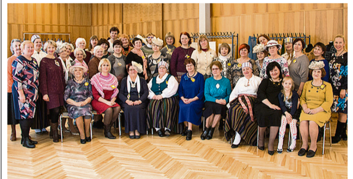
Rokdarbnieces viesošanās laikā Ropažos.