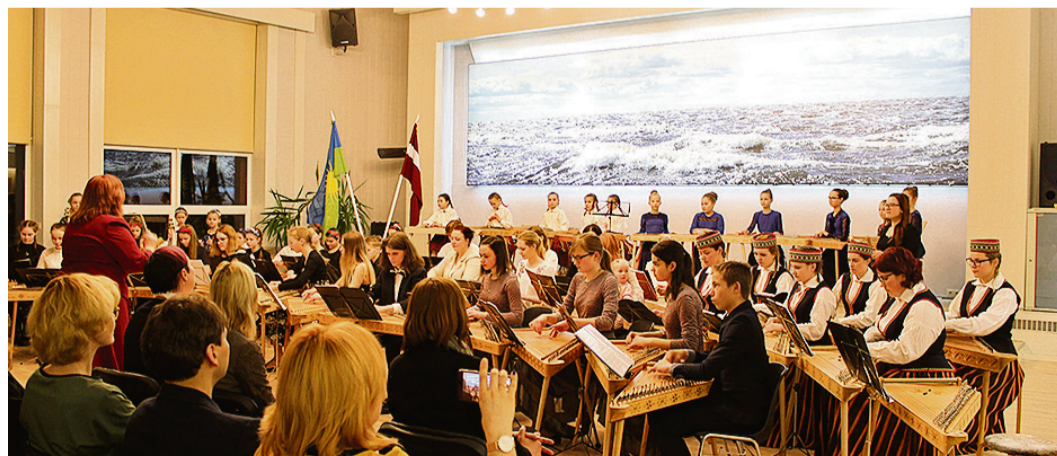
Festivāla divās dienās klausītājus priecēja 96 kokļu skaņas.

Guna Lāčauniece, lietišķās mākslas studija „Krustaines”