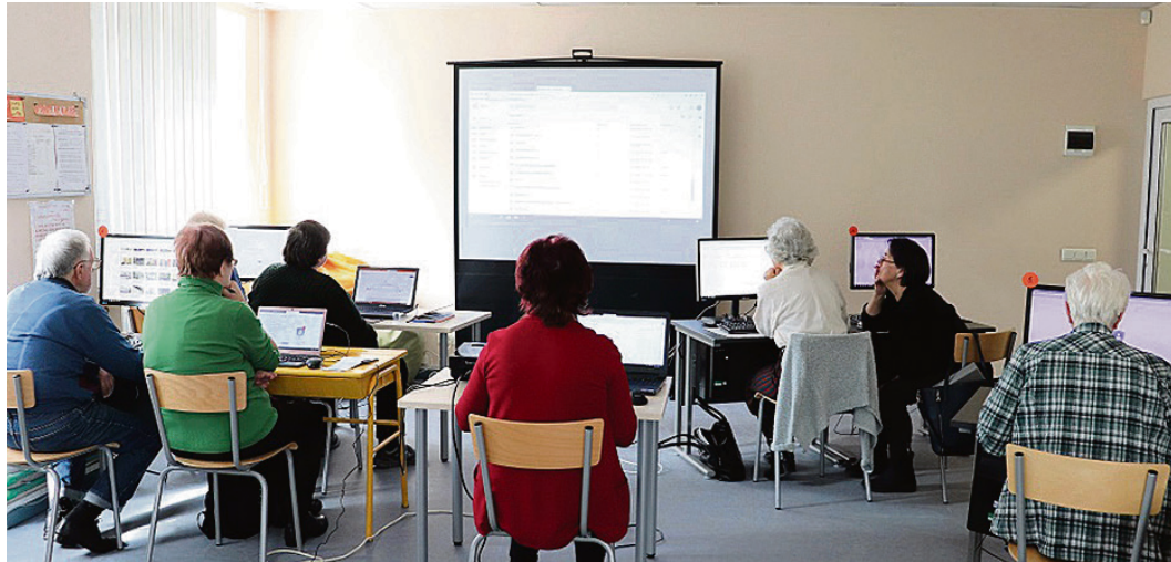
Datormācības senioriem.

Ilze Dzintare, Saulkrastu novada bibliotēka