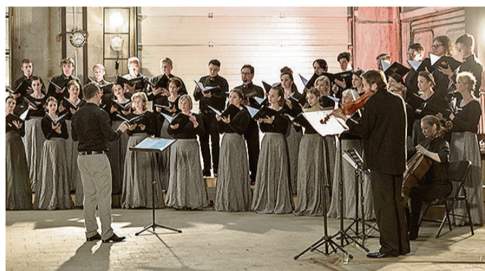
Nepieradinātajā telpā – angārā notika kora „Anima” koncerts.