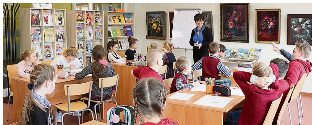
Bērnu grāmatu ilustratore A. Staka kopā ar Saulkrastu vidusskolas 4. klašu audzēkņiem radošajā darbnīcā.

10. aprīlī Saulkrastu novada bibliotēkā Saulkrastu vidusskolas 4. klašu skolēniem bija iespēja tikties ar Latvijā pazīstamo un dzīvespriecīgo mākslinieci, bērnu grāmatu ilustratori un rakstnieci Agiju Staku.