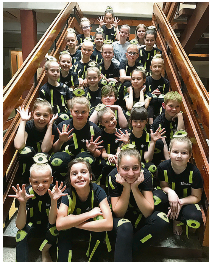
Dejas „Mikrobu tusiņš” 1.–4. klases dejotāji.