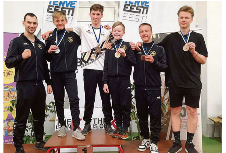
„Vidzemes karatē kluba” karatisti ar iegūtajām medaļām „Baltic Grand Prix/Budo Cup Tallinn 2019” sacensībās.

19. maijā notika karatē sacensības „Salaspils Karate Cup 2019”, kurā „Vidzemes karatē kluba” sportisti pavisam ieguva 11 godalgotās vietas disciplīnās „Kata” un „Kumite”. Godalgas saņēma arī saulkraštietis, kuri piedalījās disciplīnā „Kumite”. Mārtiņš Druva