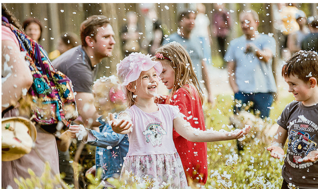
I. Saulītes instalācija „Uzmanību! Notiek mežs”.

Plkst. 20.00 Akācijas ielā 7 remonta angārā Saulkrastu jauktais koris „Anima” izpildīja Latvijas laikmetīgās mūzikas koncertprogrammu „Uz tālajām zvaigznēm”, programmas īpašais notikums bija Platona Buravicka