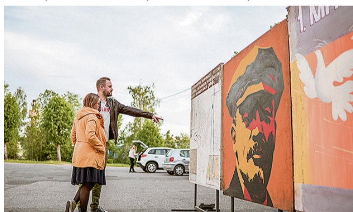
Pie k/n „Zvejniekiems” varēja ieskatīties vēsturē – 60. gadu plakātos.

Ilze Jakuša-Kreituse, Saulkrastu kultūras centrs