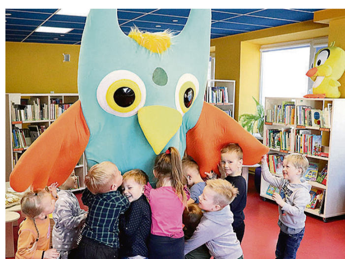
Bērni kopā ar Lielo pūci projekta „Grāmatu starts” īstenošanas laikā.

Ilze Dzintare, Saulkrastu novada bibliotēka