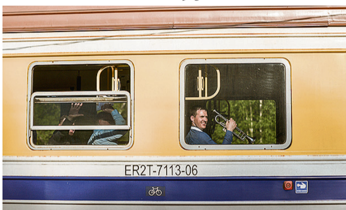
Vilcienā uz svētkiem devās pūtēju trio, kurš pavadīja viesus līdz Saulkrastu stacijai.