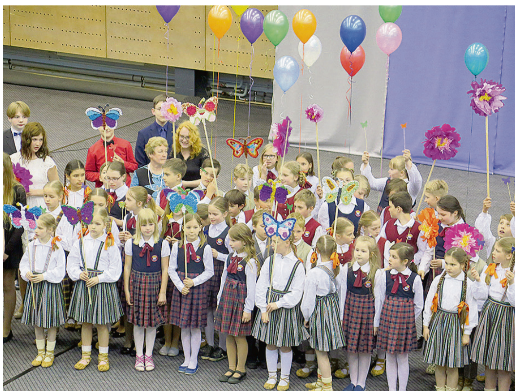
Koncertā „Māmiņas sirds krāsas”.