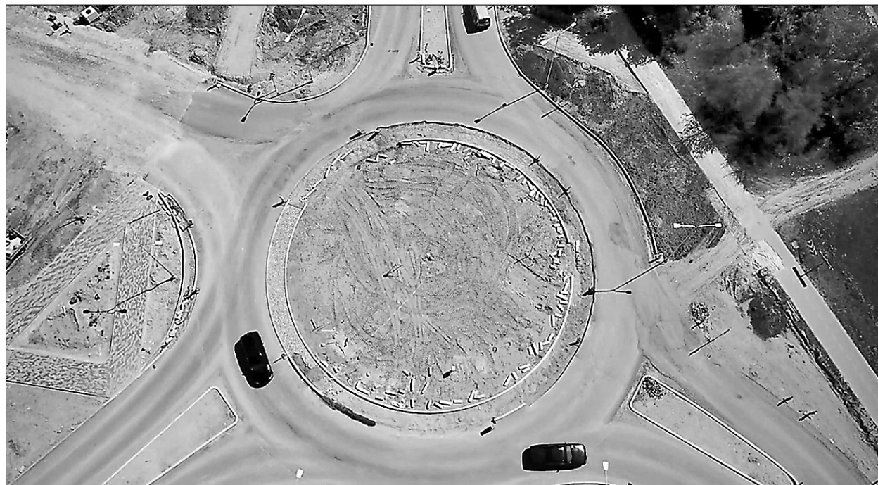
Turpinās rotācijas apla izbūvi Rīgas un Brīvības ielas krustojumā

P reiļu novada pašvaldībā varam pamatoti lepoties ar dažādu projektu izstrādi un sekmīgu to īstenošanu – 2019.gada jūnijā tiek realizēti 50 projekti gandrīz 24,8 milj. eiro apmērā, tai skaitā 11,2 milj. eiro ir Eiropas Savienības (ES) līdzfinansējums.