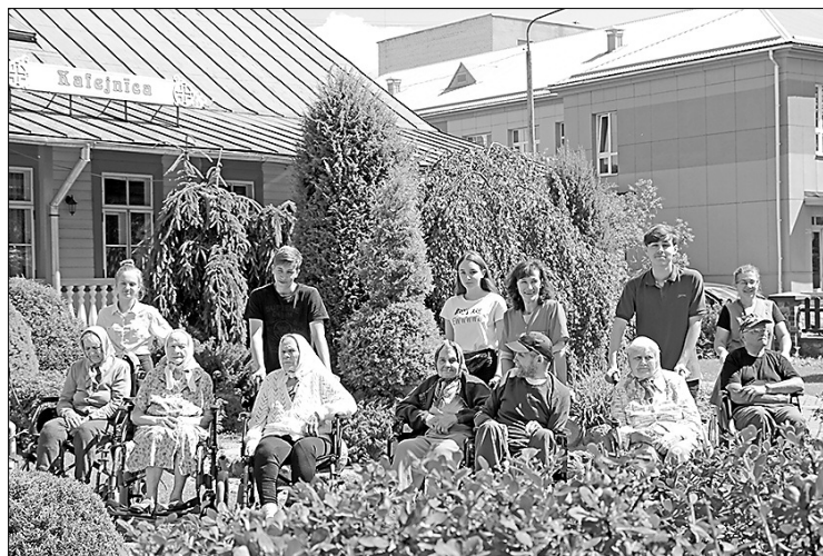
Pansionāta «Preiļi» iemūtnieki bauda vasaru aprūpētāju un viņu palīgu – skolēnu – pavadībā

Skolēnu iesaistīšanu nodarbinātības pasākumos vasaras brīvlaikā nodrošina sekojošās pašvaldības iestādes – Preiļu 1. pamatskola, Preiļu 2. vidusskola, Mūzikas un mākslas skola, Bērnu un jauniešu sporta skola, Preiļu Galvenā bibliotēka, PII «Pasaciņa»,