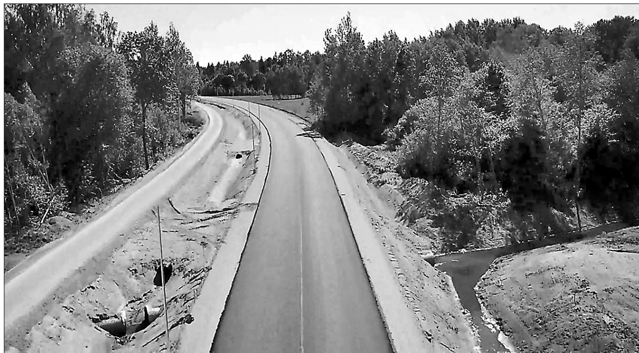
Savas aprīses iegūst jaunā Rietumu iela

Preiļu novada domes Attīstības daļas vadītāja