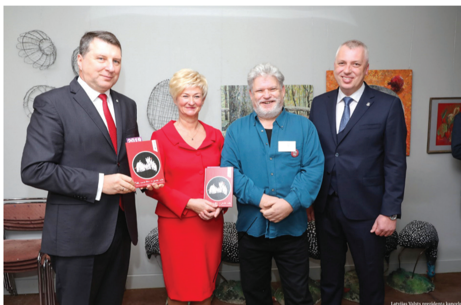
Prezidents ar kundzi iepazīs ar Talsu tautas nama un Radošās sētas aktīvajiem māksliniekiem un amatniekiem.

Viens no aktuālajiem jautājumiem valsts līmenī ir valdības deklarācijā iekļautā administratīvi teritoriālās reformas veikšana. R. Vējonis pauda personīgo viedokli, norādot, ka vispirms