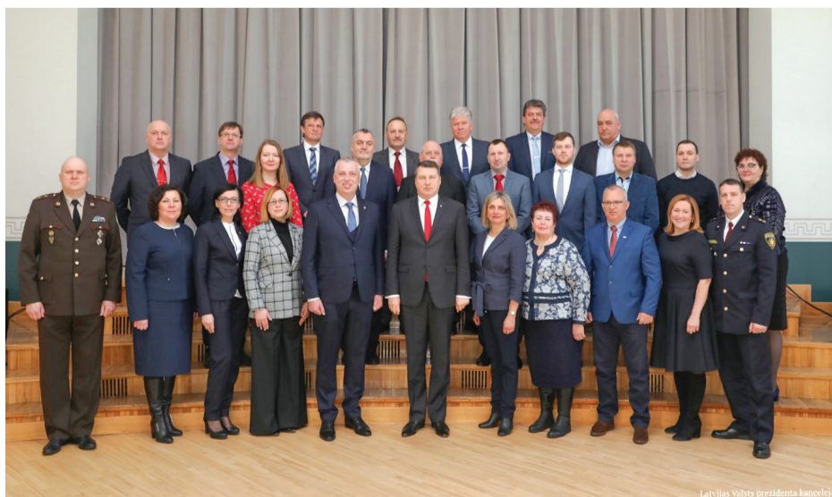
Arī novada uzņēmējiem, iestāžu un organizāciju vadītājiem bija iespēja tikties ar Valsts prezidentu.

vajadzētu pabeigt iesāktās reformas īstenošanu, kas, ievērojot iepriekš izstrādātos kritērijus, arī samazinātu kopējo pašvaldību skaitu.