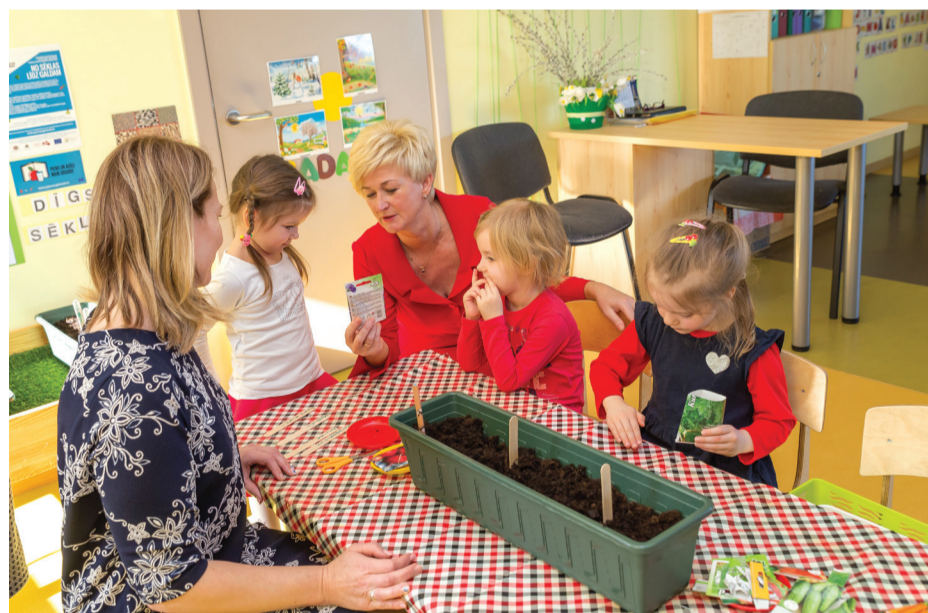
Talsu pirmsskolas izglītības iestādē „Sprīdītis” prezidenta kundze Iveta Vējone kopā ar mazajiem dēstīja pavasara sēkliņus.