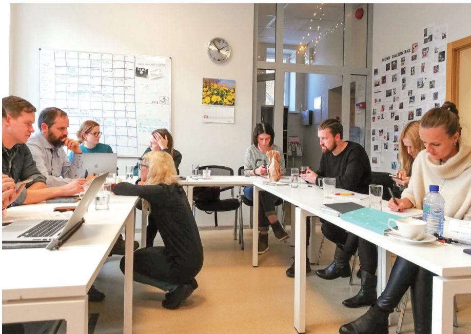
Jauno uzņēmēju „radošā saliņa” – Talsu biznesa inkubators

2018. gadā mūsu biedri radījuši septiņas jaunas darbavietas (pilnas