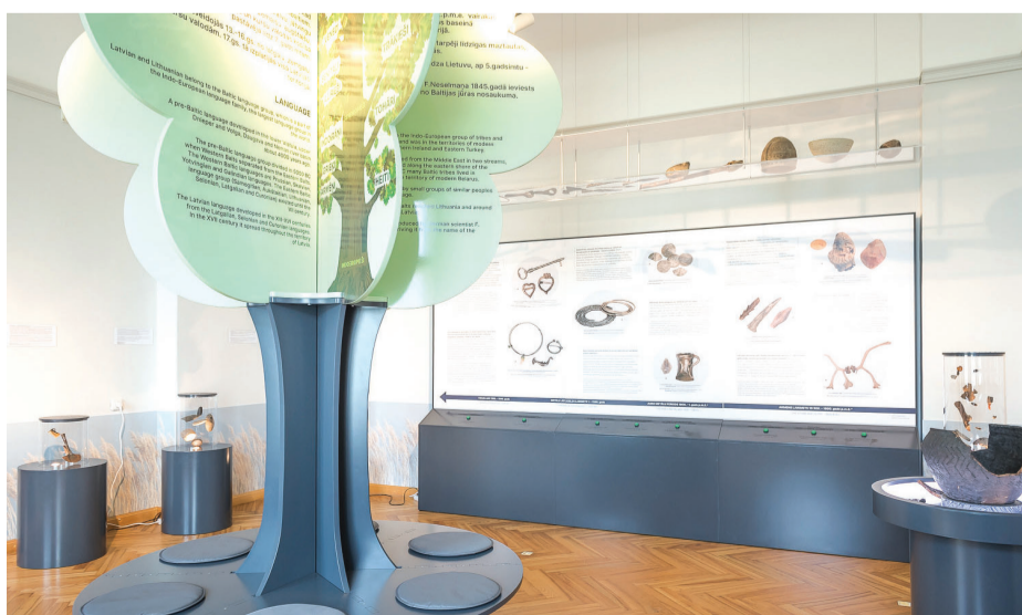
2019. gada jūnijs