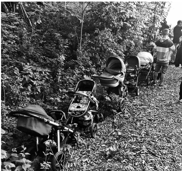
Visi rindā stāties!