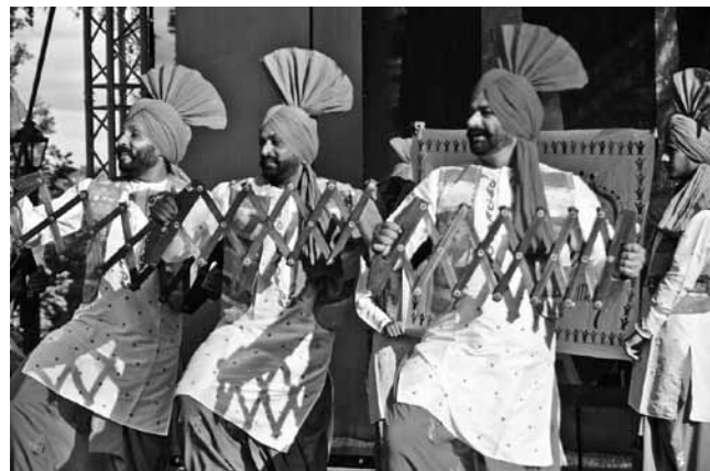
Indieši skaņas izvilināja no ļoti savdabīgiem mūzikas instrumentiem.

Kuldīgas novada domes kultūras nodaļas vadītāja Dace Reinkopa pastāstīja, ka viesiem bijušas divas brīvas stundas, kurās tie devušies