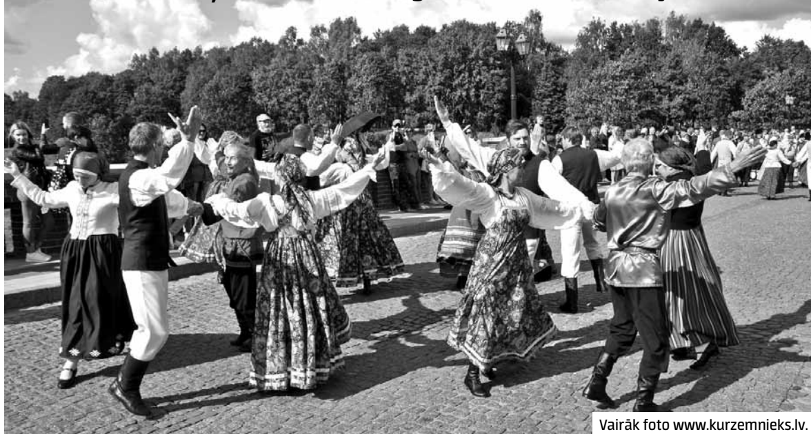
Vairāk foto www.kurzemnieks.lv .

Krāšņi, piesātināti, eksotiski – tā pēc 9. starptautiskā tautas deju festivāla Sudmaliņas koncerta Kuldīgā teica daudzi skatītāji.