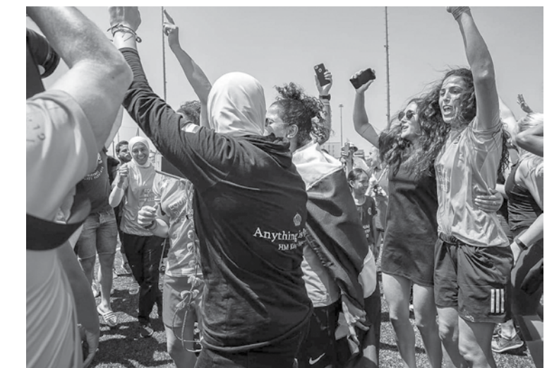
Emocijas īpaši krāšņas padarīja tas, ka piedalījās jebkāda līmeņa spēlētājas: kādai tā bija pirmā uzvara, citai pirmie vārti.

spēli apkalpoja vienu stundu. Cik tiesnešu piedalījās visilgākajā spēlē? Šajā pasākumā bijām 50 no 26 valstīm. Iznāca tāds eksotisks kokteilis. Iepazīnu tiesneses no Jamaikas, Jordānijas, Meksikas, Dienvidāfrikas, Zimbabves, Barbadosas un citām valstīm. Bija aizraujoši uzzināt arī par viņu ikdienu, tradīcijām un futbola norisēm. Esmu ļoti precīga un pateicīga par šo pieredzi, par spilgtajām emocijām, jaunām draudzībām un plašāku skatu uz pasauli. Tajās dienās tika ziņots, ka Lionā ir karstuma vilnis. Vidējā gaisa temperatūra bija plus 38 grādi. Spēkā bija oranžais brīdinājums, mācību iestādes slēgtas. Bet izturīgākie... spēlēja futbolu. Nopietni runājot, karstums bija neciešams. Daudz dzērām ūdeni, lietojām saules aizsargkrēmu.