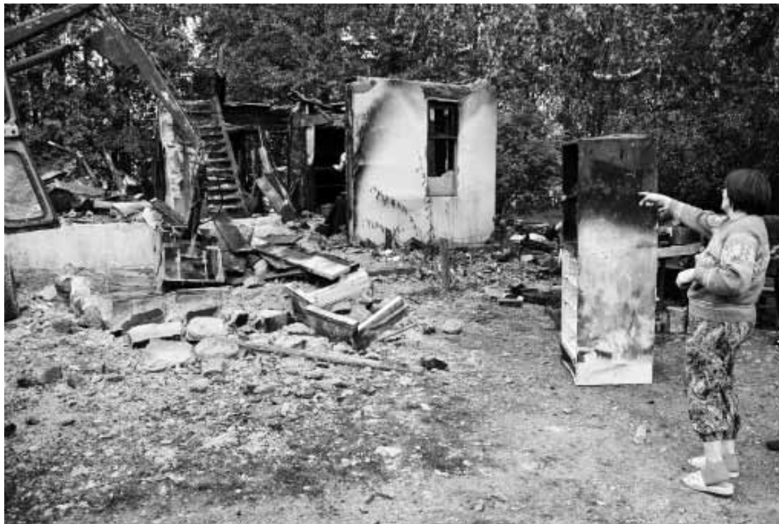
Turlavas pagasta Ķikuros Sarmīte Gūtmane rāda, kas palicis pāri no Zāģeriem – no dzīvojamās ēkas, kas nodegusi, visdrīzāk, no zibens.

„Sadega viss, ko gadiem bijām sastrādājuši,” nosaka Sarmīte. „Es kolhozā biju zootehniķe, lo-