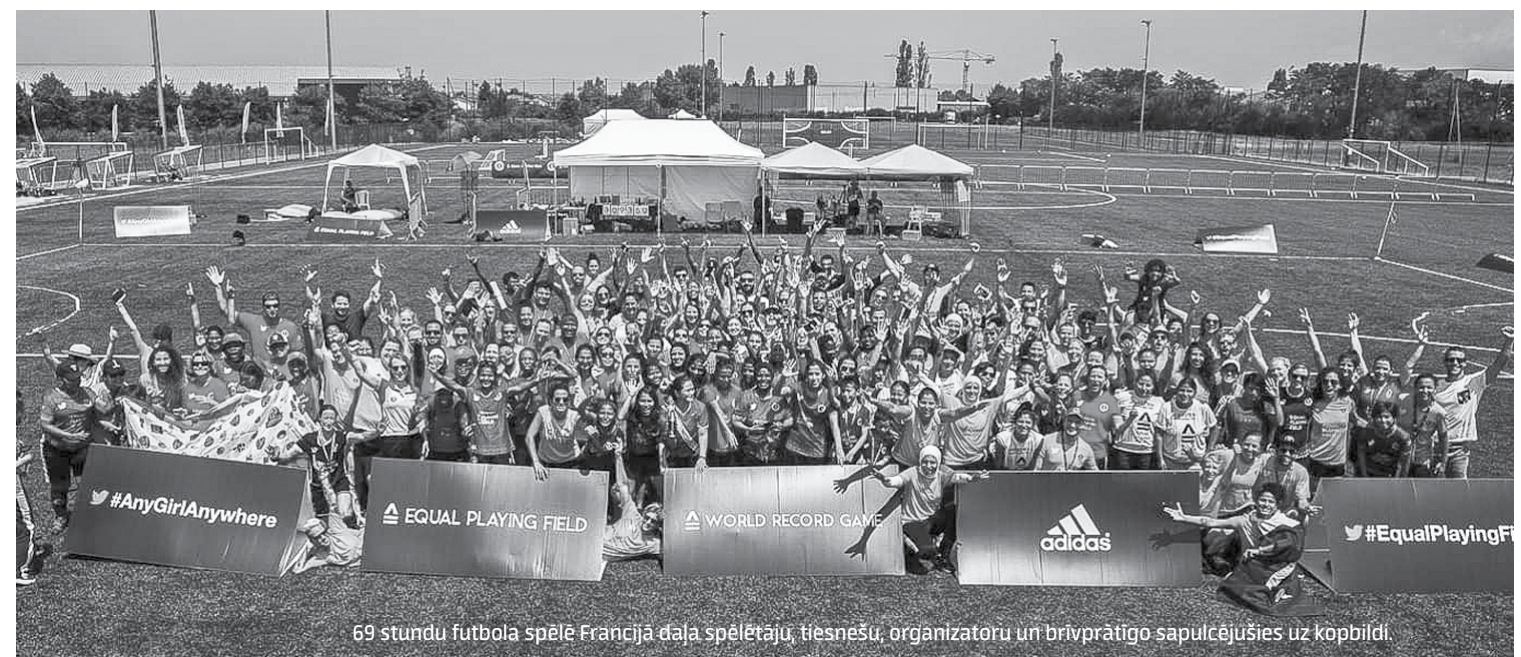
69 stundu futbola spēlē Francijā daļa spēlētāju, tiesnešu, organizatoru un brīvprātīgo sapulcējušies uz kopbildi.

Par sporta pasākumiem, rezultātiem informējiet e-pastā: inta.jansone@kurzemnieks.lv