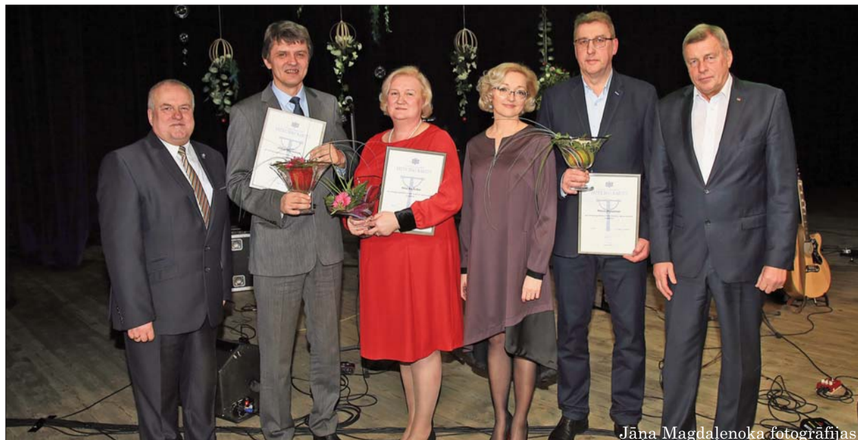
Jāna Magdaļenoka fotogrāfijas