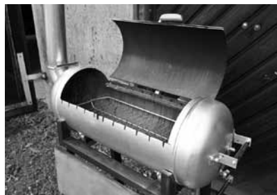
Paštaisītais grils no gāzes balona vēl nav lietots. Gan jau šovasar paspēsot.

Nobijos: ja nu kāds tiešām pamēģina? Tad ir beigas.”