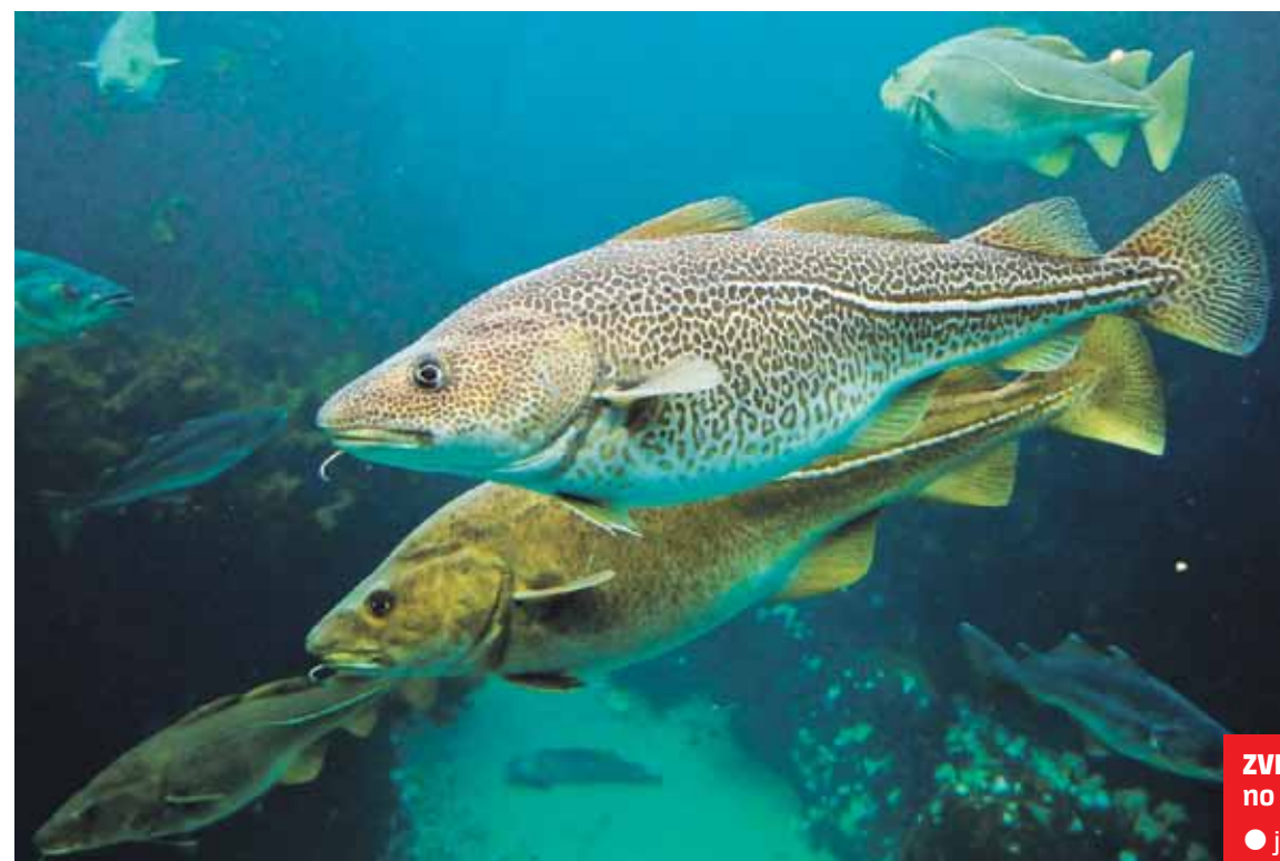
Starptautiskās Jūras pētniecības padomes zinātniskās rekomendācijas rāda, ka austrumu Baltijas mencu resursi ir kritiski un ieteikums nozvejai nākamgad – nulle. Taču aizliegums situāciju neuzlabos, jo augšanu apgrūtina galvenokārt jūras piesārņojums. Agrāk četros gados menca izauga līdz 40 cm, tagad – tikai līdz 20 cm.