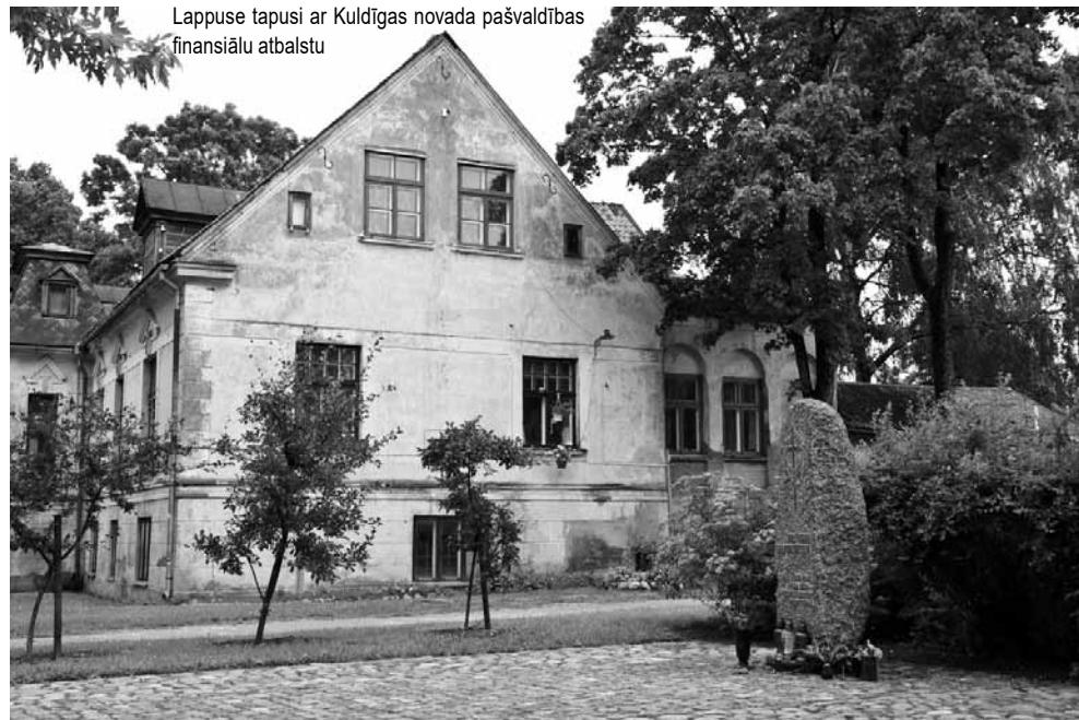
Lappuse tapusi ar Kuldīgas novada pašvaldības finansīālu atbalstu