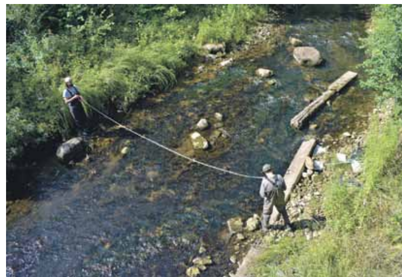
Ventas un Šķērveļa dabas liegumā tiek mērīts parauglaukums straujajā, krācīnajā un gleznainajā Šķērveļi.