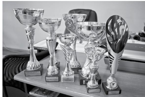
Iegūti mazāki un lielāki kausi.