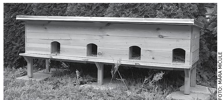
Kaķu māja Spuņciemā.

Iniciatīva uzstādīt kaķu mājas pie daudzdzīvokļu mājas Saules ielā 1, kā arī Babītē pie daudzdzīvokļu mājas Rožu ielā 2. Babītes novada pašvaldība iecerī realizējusi. Babītes novadā līdz šim klaiņojošajiem dzīvniekiem ierīkotas trīs kaķu mājas – Piņķos aiz daudzdzīvokļu mājas