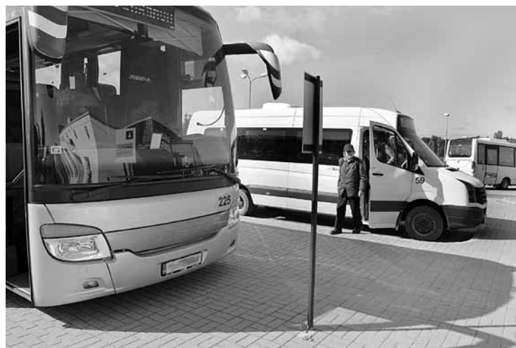
Autobusu pakalpojumiem izsludināts jauns iepirkums, bet vēl grūti prognozēt, kādi pa Kurzemi brauks pēc 2021. gada, taču tiem prasīta augsta kvalitāte.

Pretendenti var pieteikties līdz 9. septembrim. Rezultāti būs zināmi novembrī, un jau decembrī varētu slēgt līgumus, ja vien par iepirkumu nebūs strīdu.