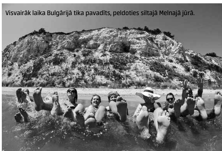
Visvairāk laika Bulgārijā tika pavadīts, peldoties siltajā Melnajā jūrā.