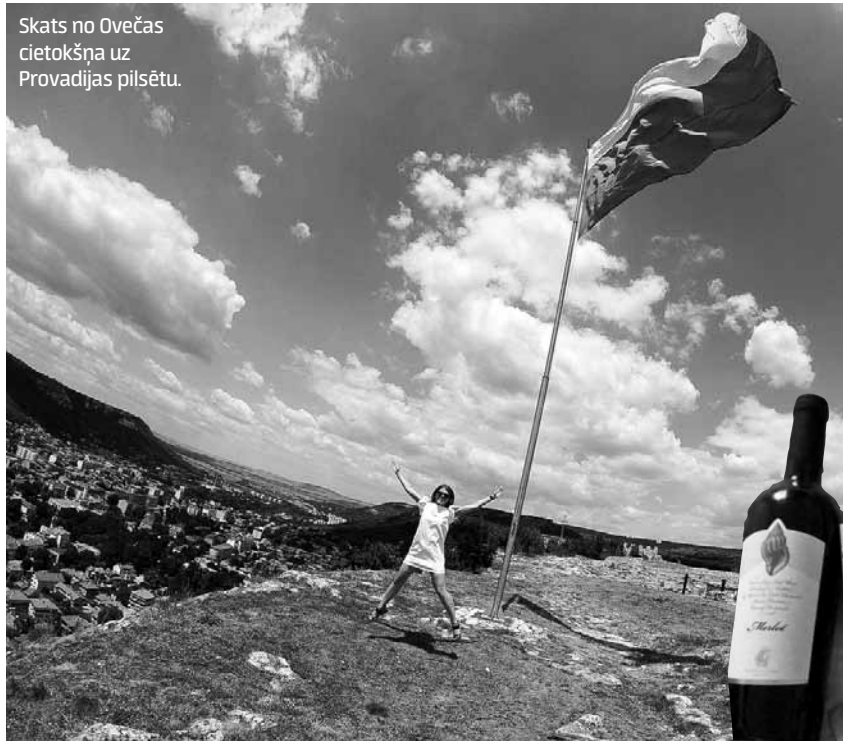
Skats no Ovečas cietokšņa uz Provadijas pilsētu.