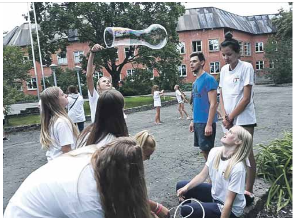
Pirmo reizi pēc vairāk nekā 40 gadiem Īvandes muižā Kuldīgas novada sporta skolas nometnes pārcēlušās citur – uz Kalnu vidusskolu Saldus novada Nīgrandē.

Antra Grīnberga