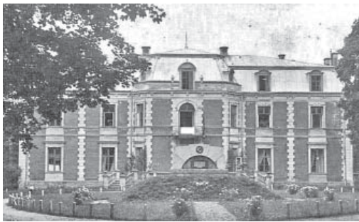
Piemineklis Bērenē 1930-tajos gados