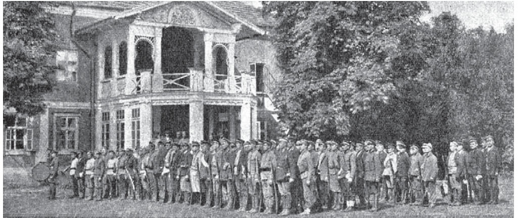
Augškurzemes partizānu pulka 2.rota Asares muižā pie pulka štāba 1919.g. jūlijā („Aizsargs” Nr.2, 01.02.1924.)