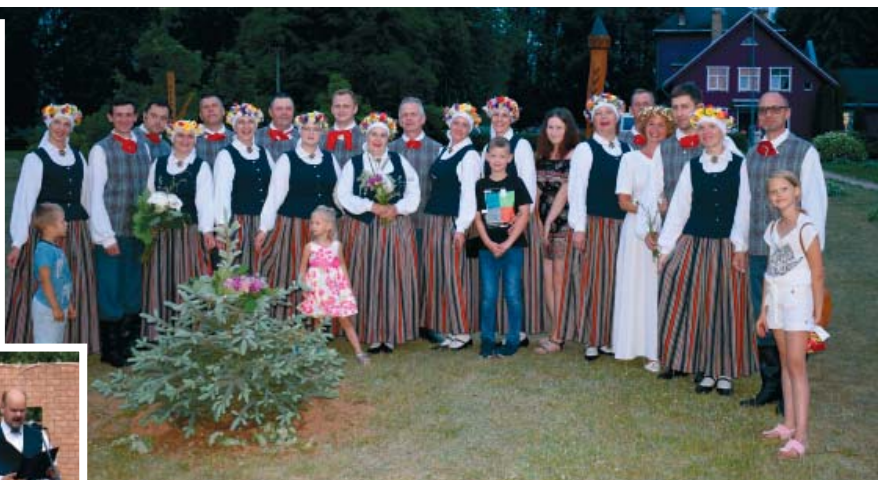
Kolektīvs “Deldze” namam jubilejā dāvāja egles stādu, lai katru gadu Ziemassvētkos nav jauna egle jācērt.