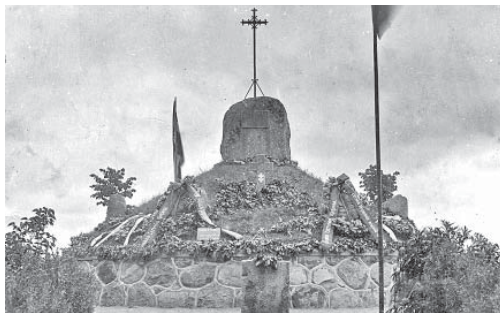
Piemineklis Asarē 1929.gadā

Notika ievietojamo dokumentu parakstīšana, ievietošana kapsulā, kuru kopā ar akmeni kapteinis J. Indāns iemūrēja paredzētā pieminekļa pamatos.