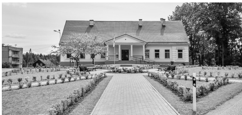
Launkalnes muiža Pilskalni.

Launkalnes pagasta lepnums ir krāšņā un maz skartā daba, kas piesaista daudzu cilvēku uzmanību, tāpēc Launkalnes pagasta iedzīvotāji rūpējas, lai bagātīgo un interesanto dabas krāšņumu ieraudzītu gan savējie, gan viesi. Lielākā pagasta teritorijas daļa atrodas Vidzemes augstienes Mežoles paugurainē. Pavisam pagastā atrodas 23 pauguri, no tiem lielākā daļa virs 150 metri v.j.l., augstākais pagastā un visā novadā ir Slapjuma kalns (248 metri v.j.l.). Pagastā atrodas Mežoles liegums, kas ir īpaši aizsargājama dabas teritorija. Tas ir viens liels vienlaidu meža masīvs ļoti paugurainā reljefā. Specifis-