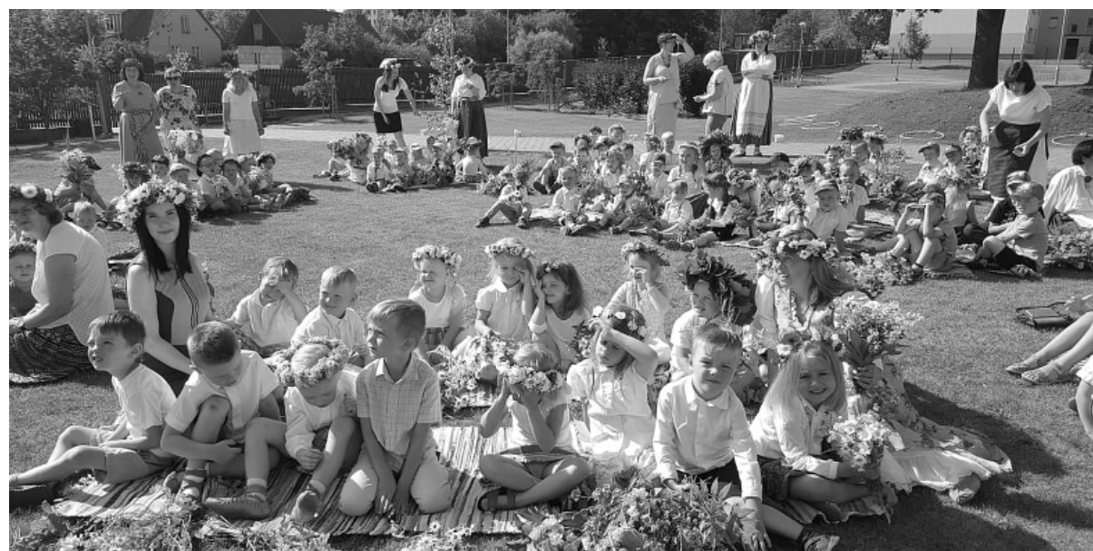
Mazie un lielie līgotāji.

Gatavojoties svētkiem, māmiņas un tēti parūpējās par baltu kreklu un tautiskiem svārciņiem, kā arī kopā ar saviem bērniem izstaigāja neskaitāmas Smiltenes apkārtnē esošas saules apmirdzētas un ziedu piepildītas pļavas, lai savītu krāšņus vainadziņus savām meitām un saplūktu košu Jāņu zāļu pušķi saviem dēliem. Madaras, rudzupuķes, smilgas un margrietniņas rotājās ziedu vainagos, godinot un simbolizējot sauli.