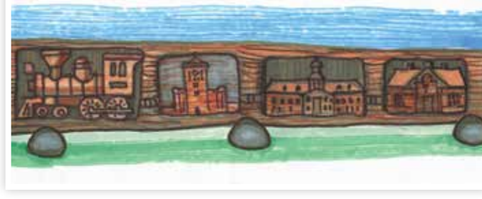
Attēls: mākslinieka skice