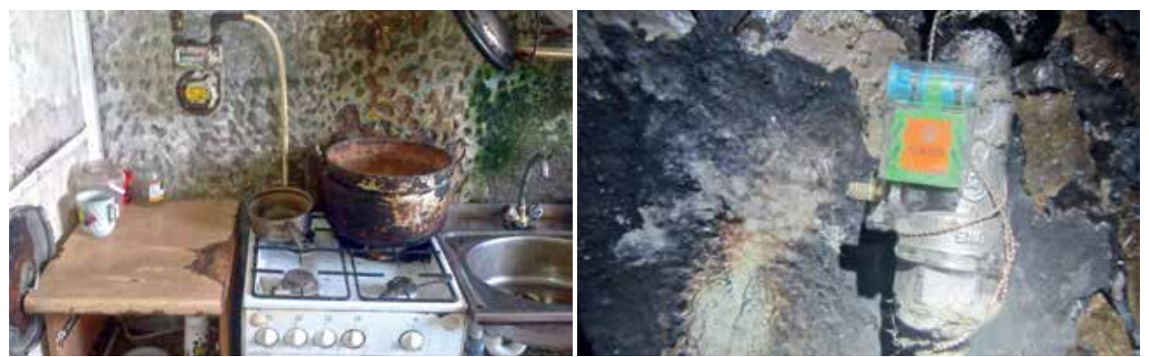
2017. gadā uz izsaukumiem, kas saistīti ar gāzes noplūdi telpās, AS «Gaso» Avārijas dienests Jelgavā izbraucis 117, bet pērn – 116 reizes. Bijuši arī gadījumi, kad gāzes noplūde beigusies ar degšanu, piemēram, Atmosas un Pētera ielā.