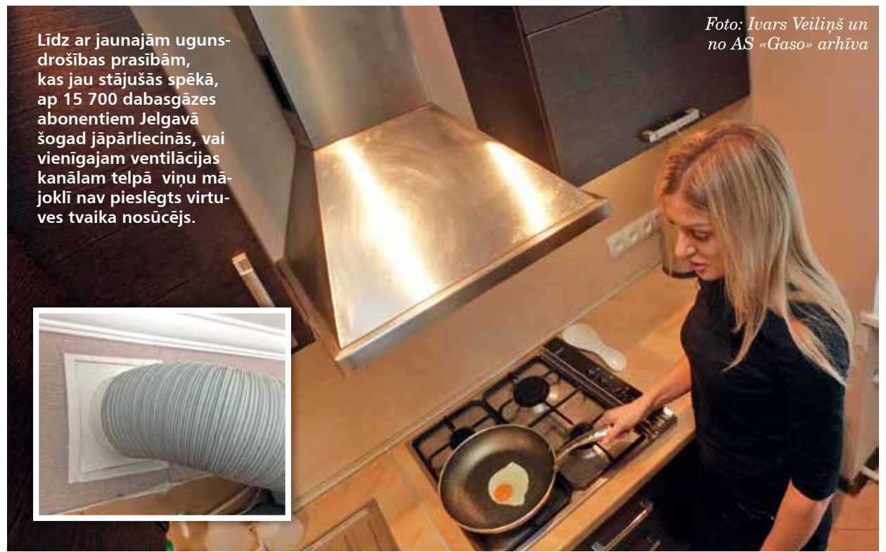
Līdz ar jaunajām ugunsdrošības prasībām, kas jau stājusies spēkā, ap 15 700 dabasgāzes abonentiem Jelgavā šogad jāpārlicinās, vai vienīgajam ventilācijas kanālam telpā viņu mājoklī nav pieslēgts virtuves tvaika nosūcējs.

Provizorisks cena šādam nosūcējam ir 50–300 eiro atkarībā no ražotāja un ierīces papildu funkcijām, bet filtra cena ir 5–50 eiro.