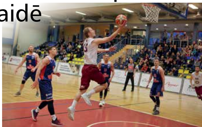
Pusfināla sēriju BK «Jelgava/LLU» sākusī ar zaudējumu «Ķekavai». Atbildes spēle – jau piektdien.