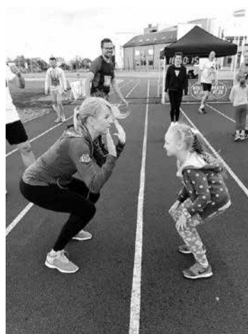
Kārtīga iesildīšanās ir veiksmes atslēga jebkurā skrējienā.

Nākamais posms notiks 16. jūlijā stadionā, bet augustā skrējēji tiksies jau botāniskajā dārzā. Veiksmīgus startus!