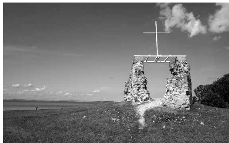
Sv. Jura baznīcas drupas.