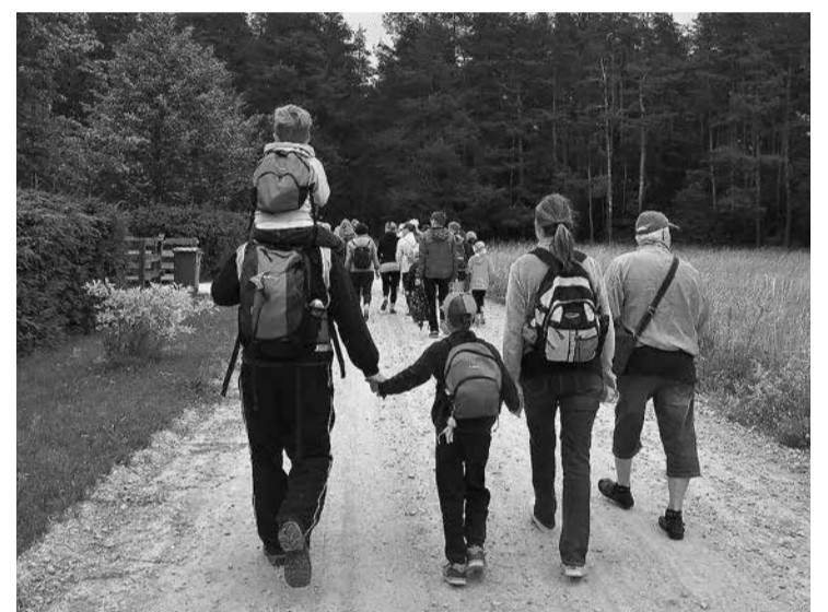
Pārgājiens ir lielisks veids, kā pavadīt sestdienu kopā ar ģimeni.

Initas daļas pārdomās: "Manuprāt, ikdienā Doles salas putekļainais ceļš neko nevēsta, taču paskatoties pa labi, pa kreisi un ieklausoties gan priēžu šalkās, gan putnu dziesmās, bet pats