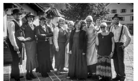
Allaž smaidīgi un jauki – tādi ir mūsu teātra dalībnieki.

Hallo (vācu "čau") vasarā! Pietrūkst lustes, drāmas, darbības un emociju? Neskaudiet, bet "Salaspils teātris" no 7. līdz 11. jūnijam izklaidējās (lasīt – strādāja) Austrijas pilsētā Abtenavā (Abtenau), kur piedalījāties 9. Starptautiskajā teātru festivālā "Abtenau is Stage" ar divām izrādēm – Ādolfā Alunāna joku spēli "Šneiderienes" un muzikālo drāmu par meksikāņu gleznotāju Frīdu Kalo "Domājot par Frīdu...".