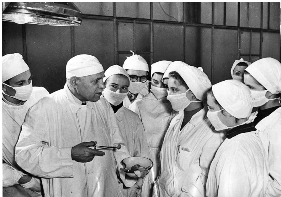
Pauls Stradiņš ar ķirurģijas studentiem. Rīga, 20. gs. 50. gadu pirmā puse.

Izstādes galvenais uzdevums ir sniegt skatītājam iespēju sajust medicīnas darbinieka un pacienta attiecību patieso būtību: tiesības saņemt un pienākums sniegt palīdzību neatkarīgi no apstākļiem, karā vai mierā, nabadzībā vai bagātībā, neatkarīgi no pārliecības, vecuma, rases, nacionalitātes vai politiskās pārliecības. Lai uzsvērtu šo misiju, par centrālo caurviju tēlu visiem vēsturiskajiem periodiem ir kļuvusi medicīnas māsa, kuras sākotnējais nosaukums ir bijis žēlsirdīgā māsa.